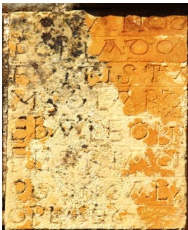
1. b. Chronicae historicae en la iglesia de San Julián y Santa Basilia. Rebolledo de la Torre (Ap. nº 101)