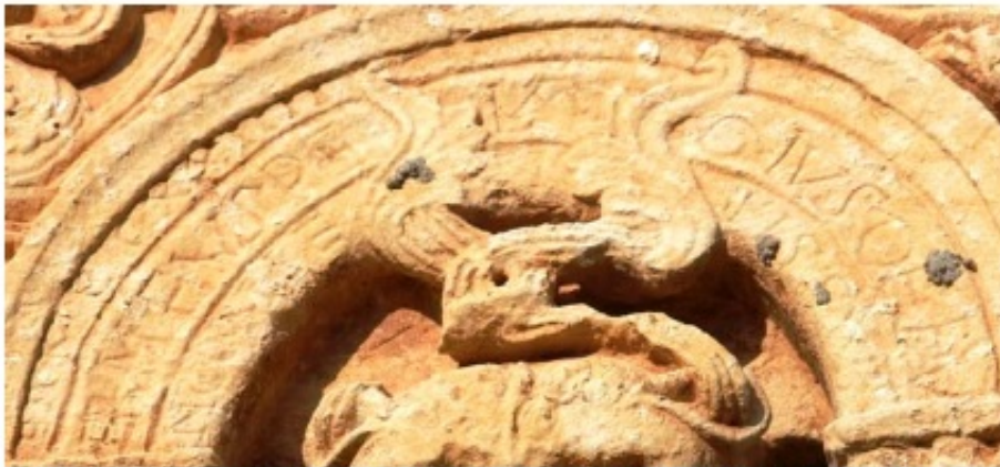
1. a. Chronicae historicae en la iglesia de San Julián y Santa Basilia. Rebolledo de la Torre (Ap. nº 101)