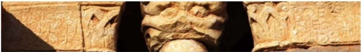
1. a. Chronicae historicae en la iglesia de San Julián y Santa Basilia. Rebolledo de la Torre (Ap. nº 101)