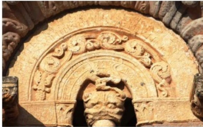
1. a. Chronicae historicae en la iglesia de San Julián y Santa Basilia. Rebolledo de la Torre (Ap. nº 101)