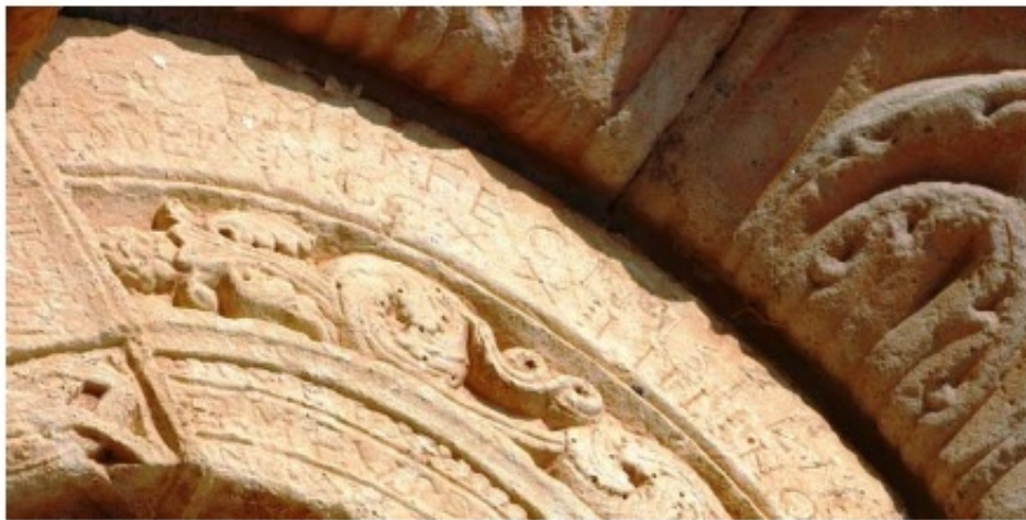
1. a. Chronicae historicae en la iglesia de San Julián y Santa Basilia. Rebolledo de la Torre (Ap. nº 101)