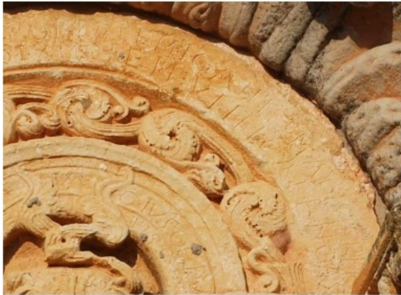
1. a. Chronicae historicae en la iglesia de San Julián y Santa Basilia. Rebolledo de la Torre (Ap. nº 101)