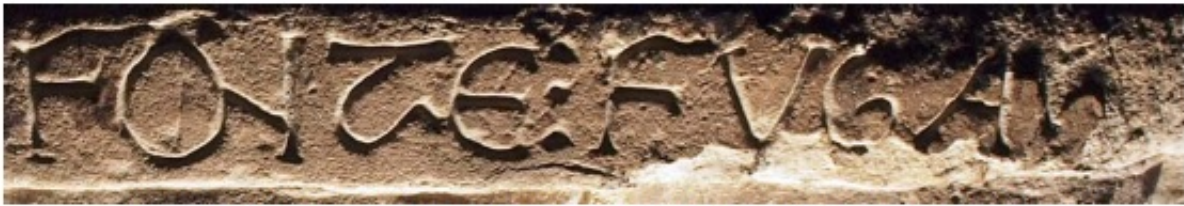
1. Hortatio de la pila bautismal de la iglesia de la Visitación. Barbadillo de Herreros (Ap. n.º 104)