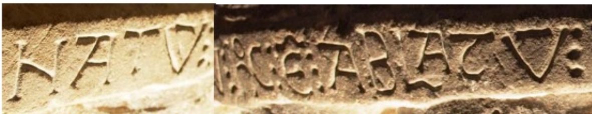
2. Hortatio de la pila bautismal de la iglesia de la Visitación. Barbadillo de Herreros (Ap. n.º 104)