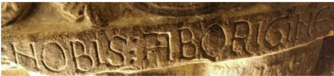
2. Hortatio de la pila bautismal de la iglesia de la Visitación. Barbadillo de Herreros (Ap. n.º 104)