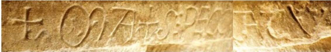
2. Hortatio de la pila bautismal de la iglesia de la Visitación. Barbadillo de Herreros (Ap. n.º 104)