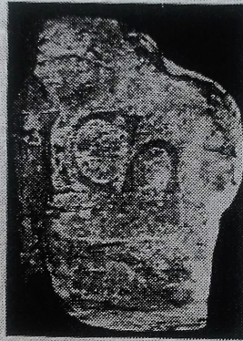
FIG. 1 — As três letras agora encontradas