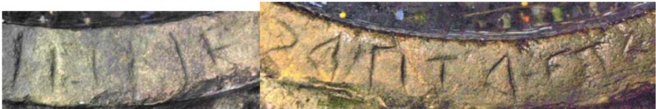
2. Tipología indeterminada en la pila bautismal del Caniego. Caniego (Ap. n.º 118)