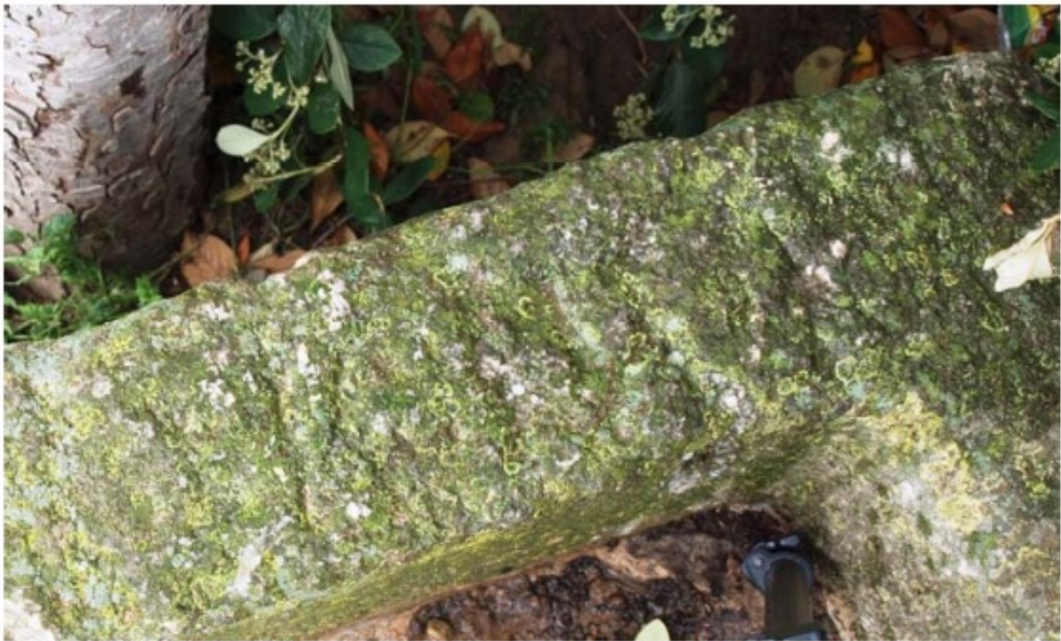
1. Intitulatio suscriptionis de la pila bautismal de San Andrés. Grisaleña (Ap. n.º 122)