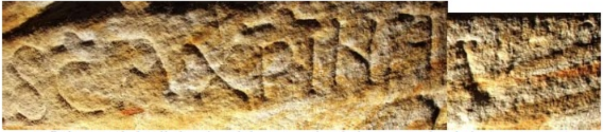
1. Roboratio de la pila bautismal de Huerta de Abajo. Huerta de Abajo (Ap. n.º 129)