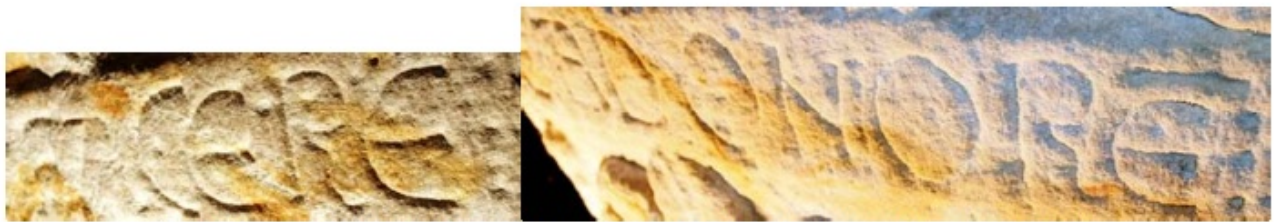
2. Roboratio de la pila bautismal de Huerta de Abajo. Huerta de Abajo (Ap. n.º 129)