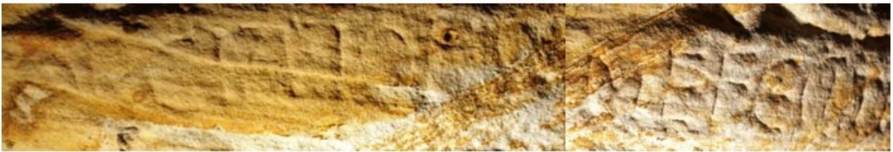
2. Roboratio de la pila bautismal de Huerta de Abajo. Huerta de Abajo (Ap. n.º 129)