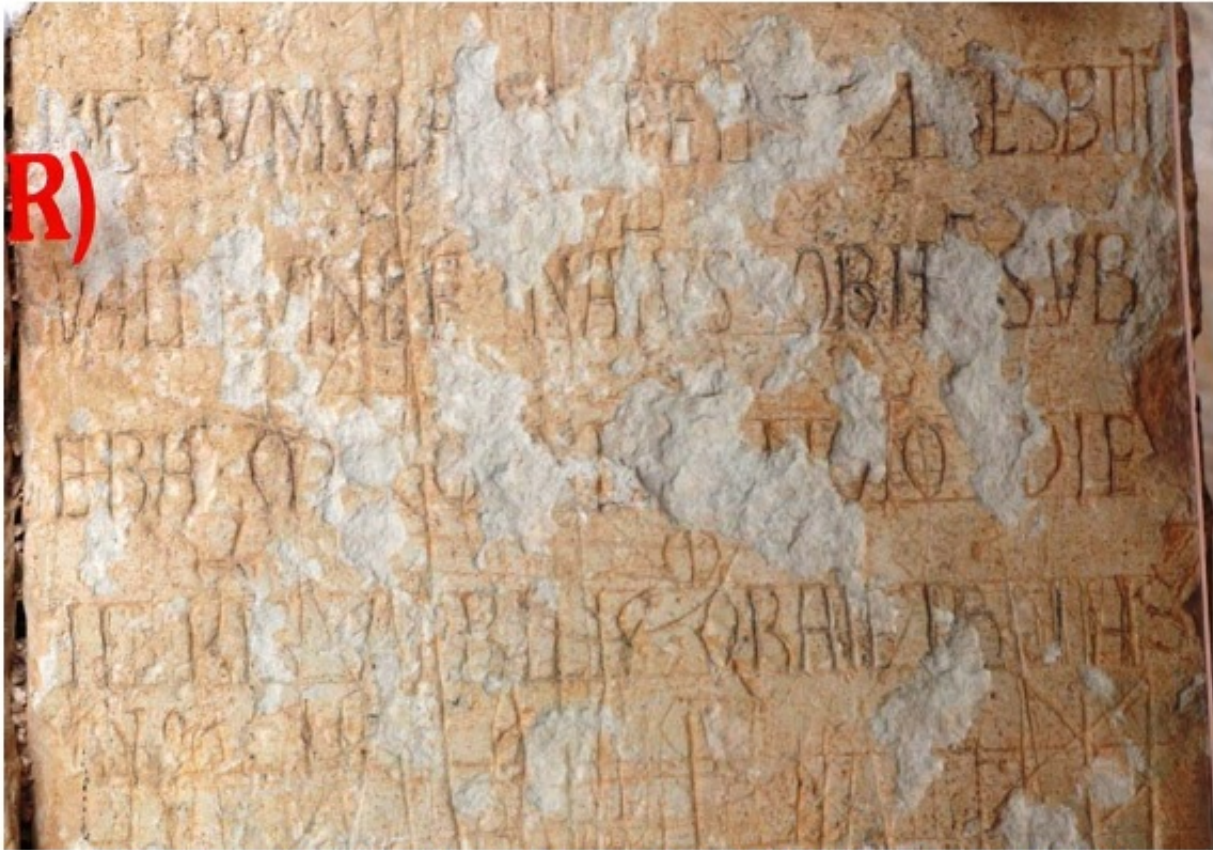
1. Epitaphium sepulcrale del presbítero Pedro en la iglesia de San Miguel. Valdenoceda (Ap. n. ° 151)