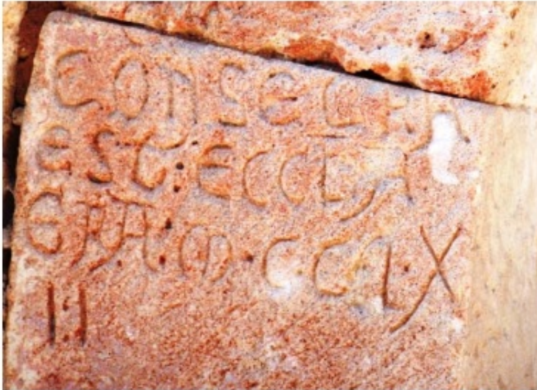
2. a. Consecratio (minuta) de la iglesia de Nuestra Señora. San Vicente del Valle (Ap. n.º 152)