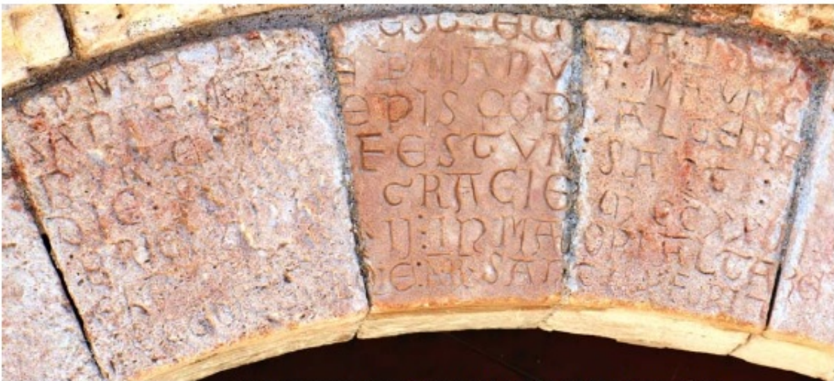
1. b. Consecratio de la iglesia de Nuestra Señora. San Vicente del Valle (Ap. n.º 152)