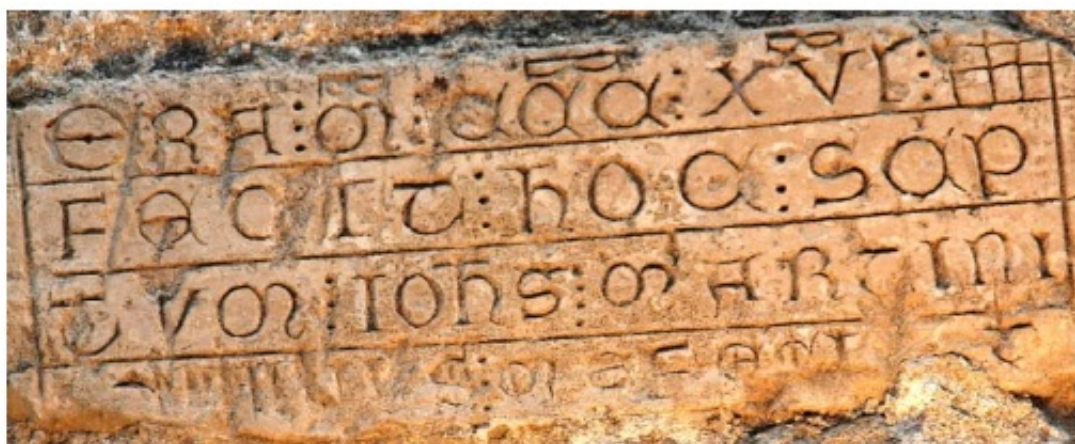
l. b. Suscriptio de la iglesia de San Nicolás de Bari. Arroyuelo (Ap. n.º 168)