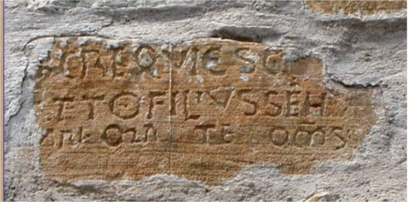
Captura de pantalla 2023-03-112752