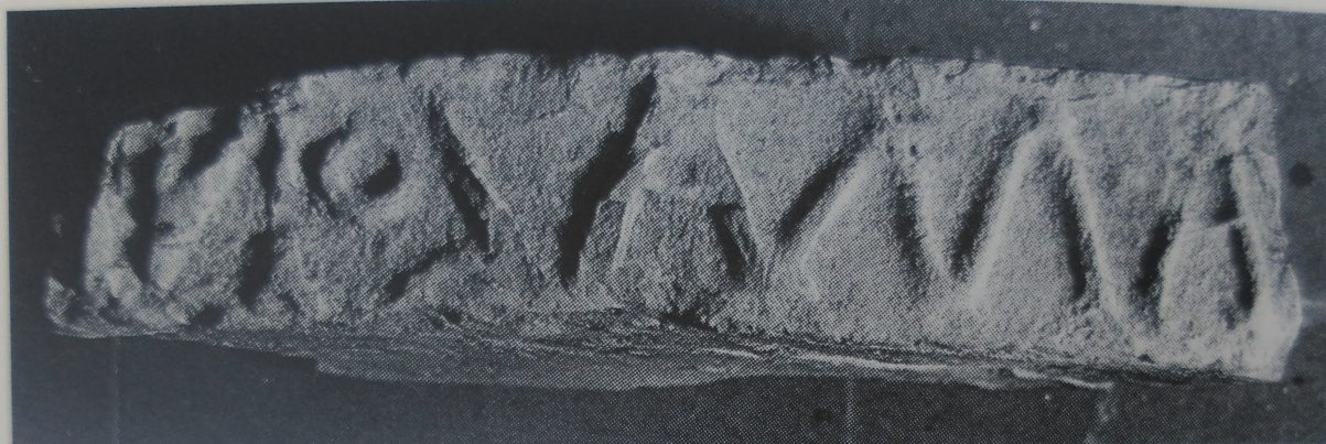
Fig. 3: 7, 194 a 2 (latus maius)