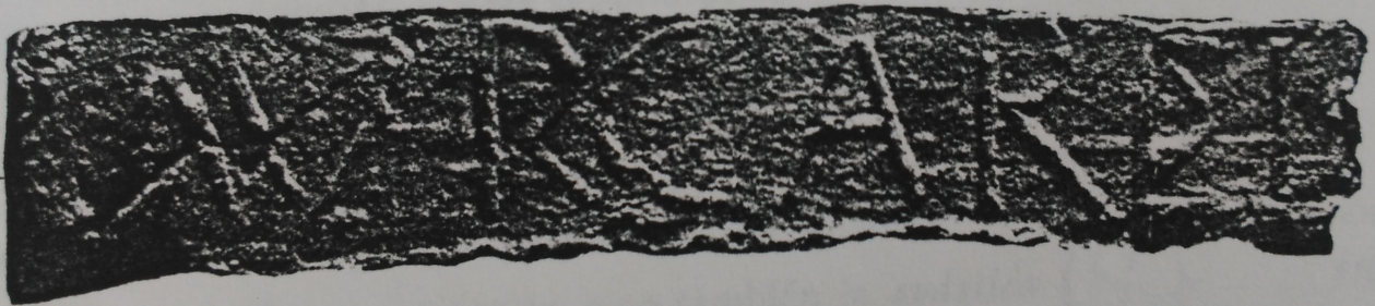
Lámina XVIII, 1.- Ladrillo con inscripción AVR CARISI.