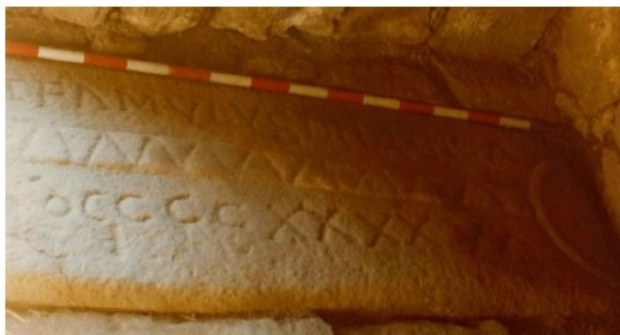
Imagen O10. © Archivo de Galicia, G6037.