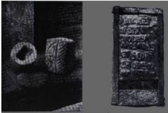
Fig. 76: Ara y relicario del ábside norte (Íñiguez Almech, 1955)