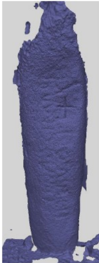
Imagen O33. Dcha. modelo generado con Agisoft Metashape.