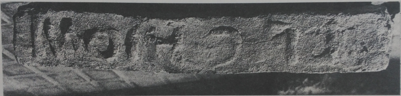
Im. phot. lat. longioris.