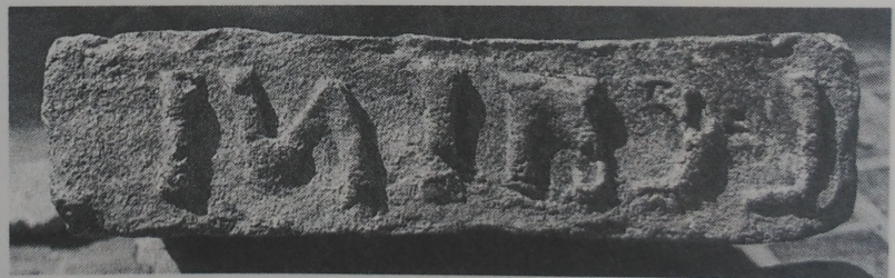
Im. phot. lat. brevis alterius.