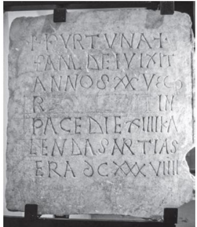
Fig. 2 IHC 338: vista completa del reverso.