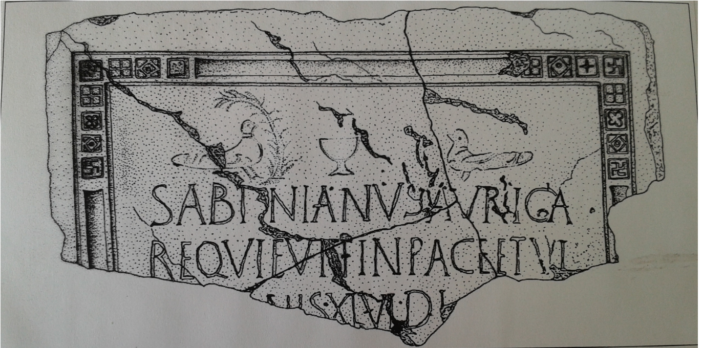
Figura 1. Inscripción de Sabinianus.