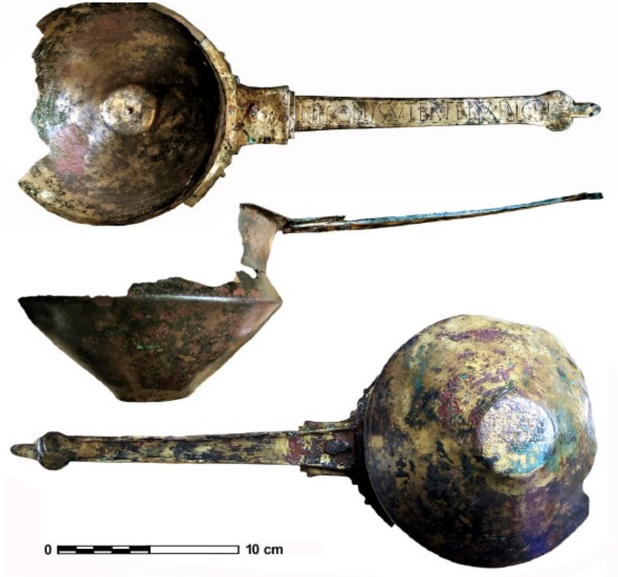
Figura 1. Simpulum de Baena (vista superior, lateral e inferior).