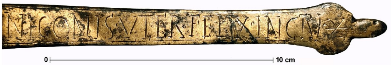
Figura 2. Detalle del mango con la inscripción.