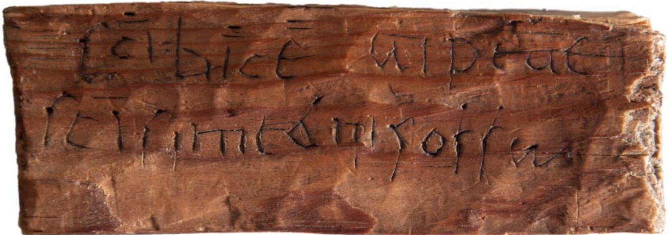
Inscripción de lipanoteca de Tella