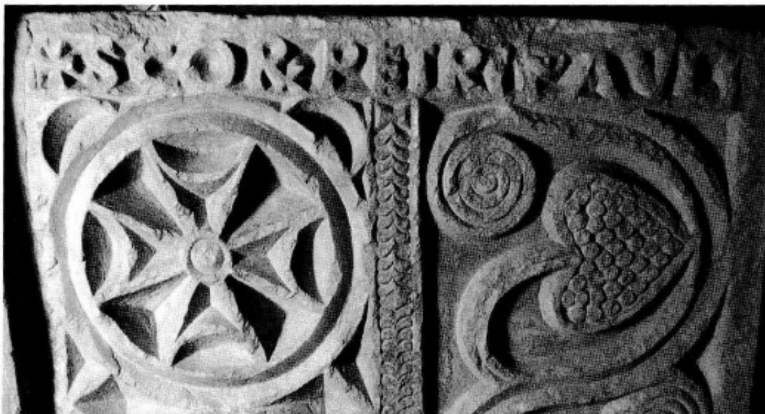
Fig. 8. Inscripción de la placa sur.