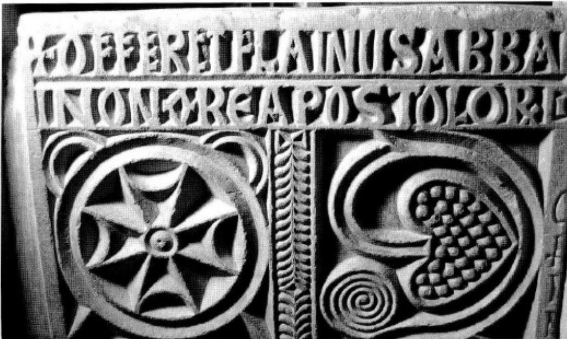
Fig. 7. Inscrpción del siglo IX en la placa norte.