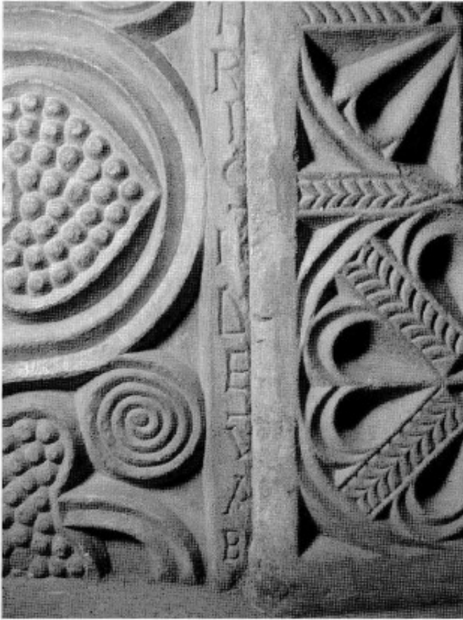
Fig. 5. Inscripción visigoda (parte inferior).