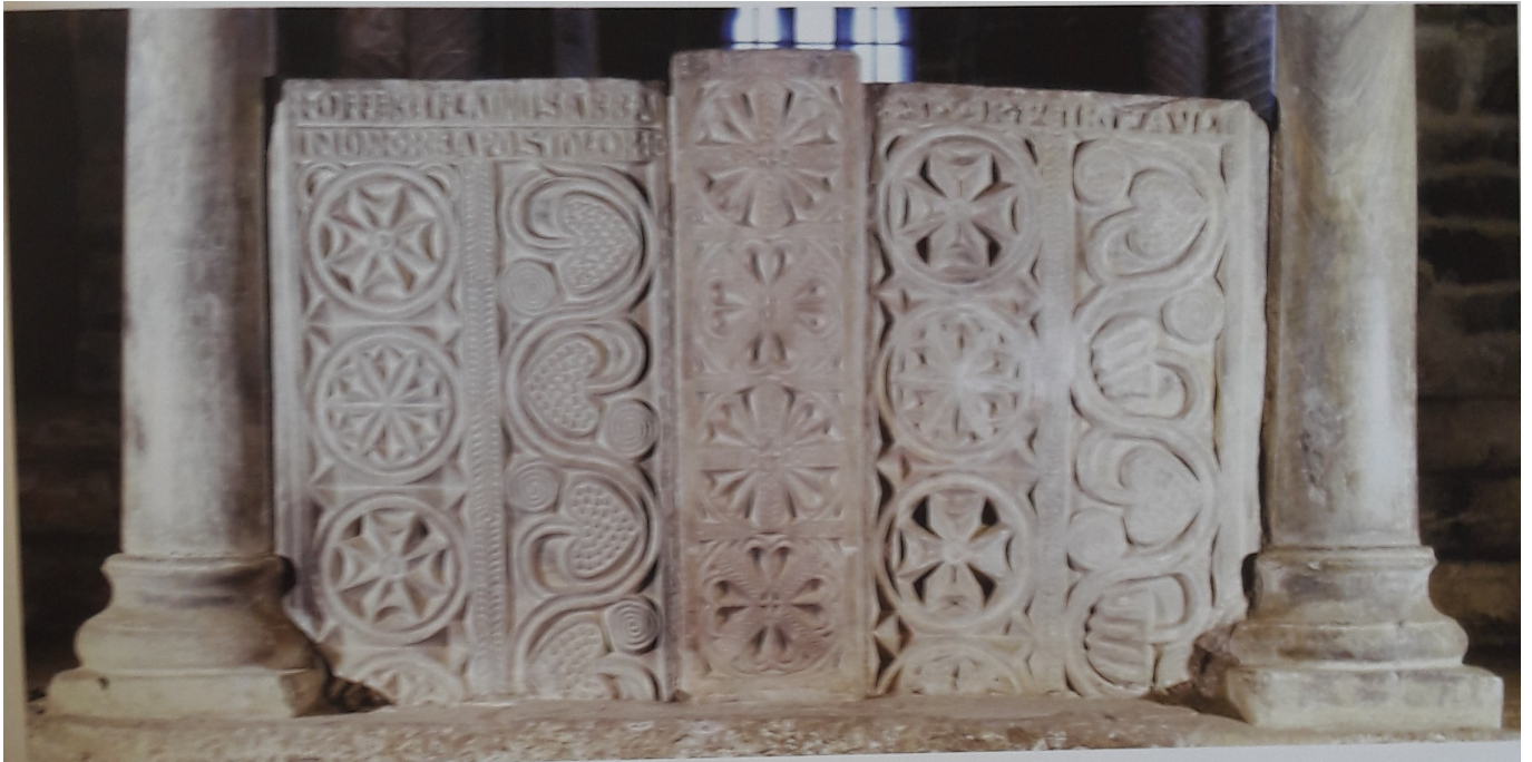
Canal situado en la parte inferior de la arqueta