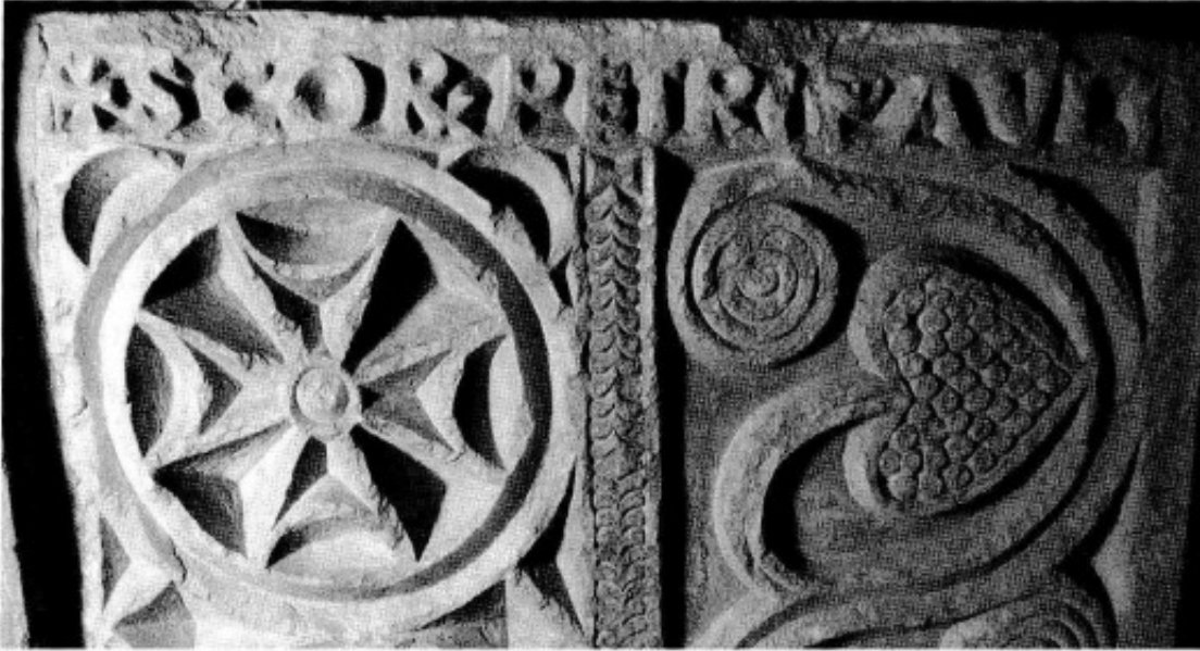
Fig. 8. Inscripción de la placa sur.