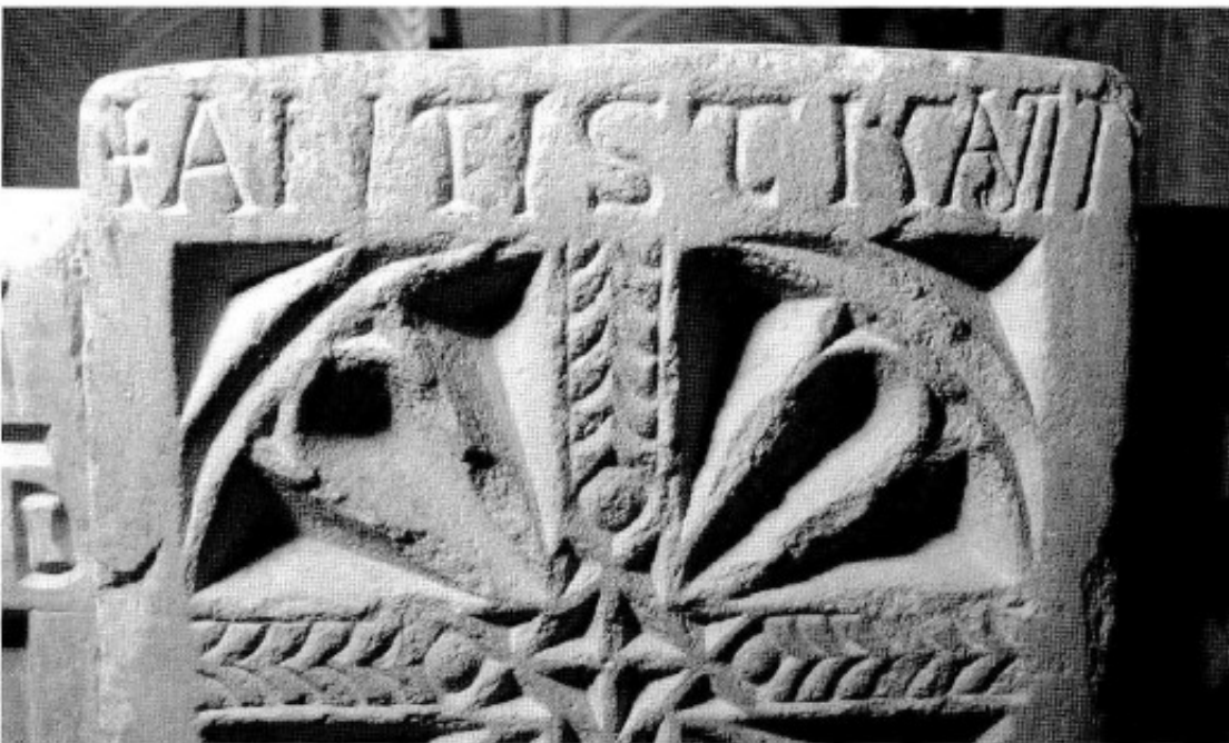
Fig. 9. Inscripción del larguero central.