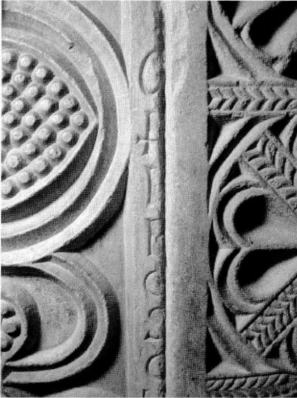
Fig. 3. Inscrpción visigoda (parte media).