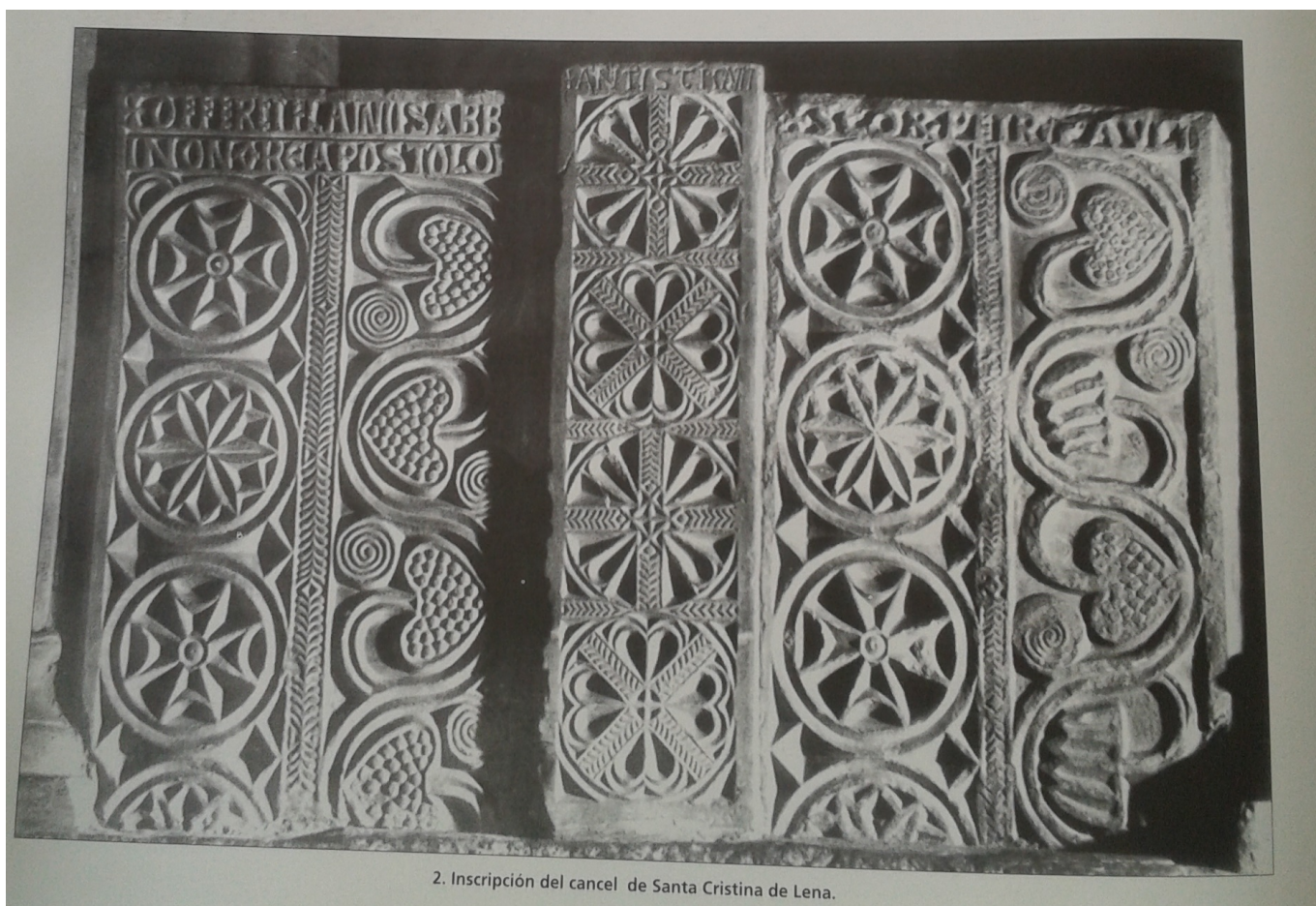
2. Inscripción del cancel de Santa Cristina de Lena.