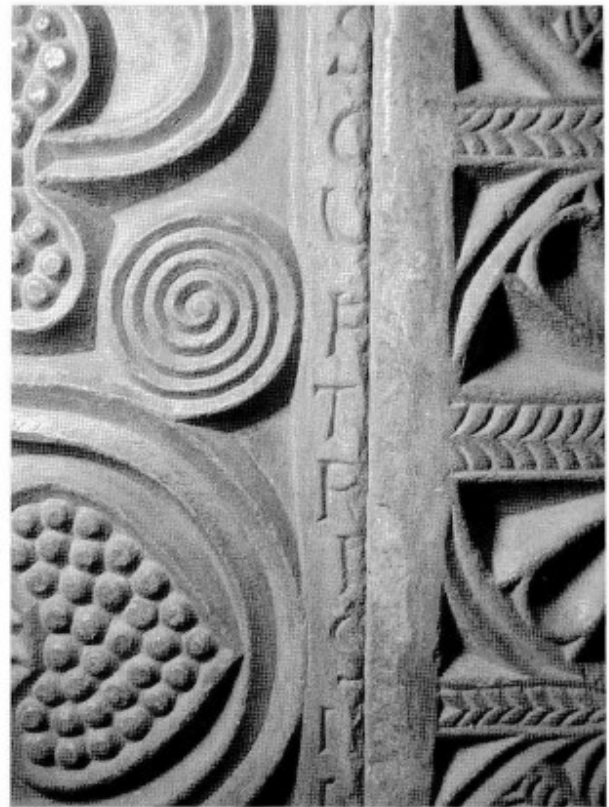
Fig. 4. Inscrpción visigoda (parte superior).