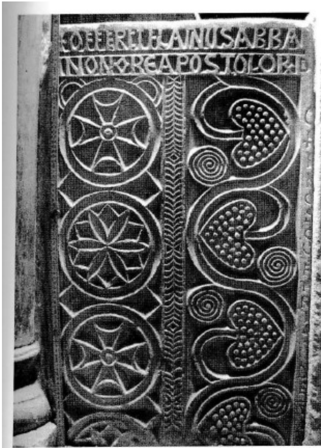
Fig. 2. Placa situada en la zona norte.