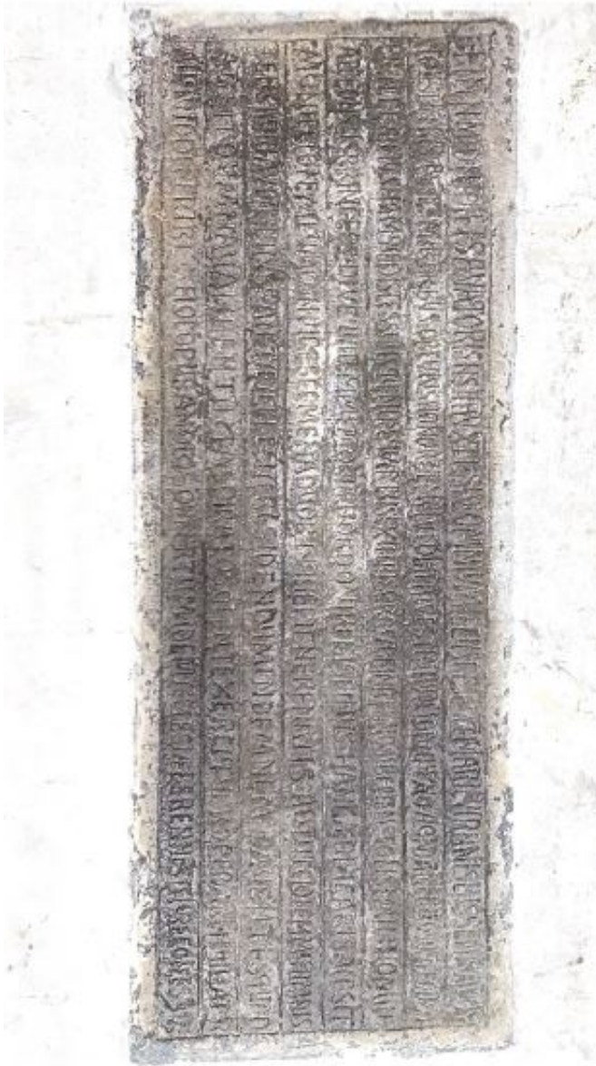
Fortaleza, p. 14