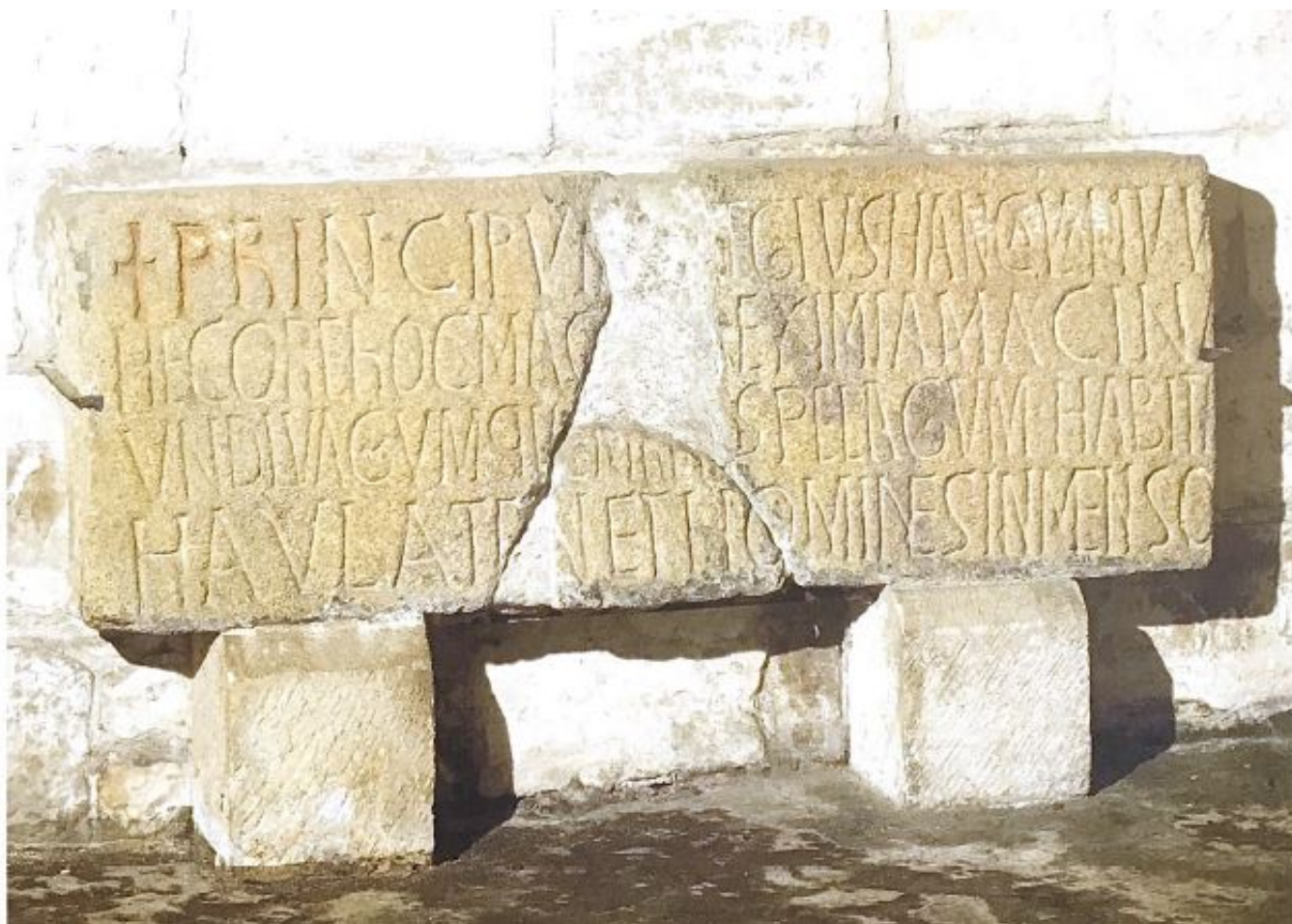
Santa Leocadia, p. 15