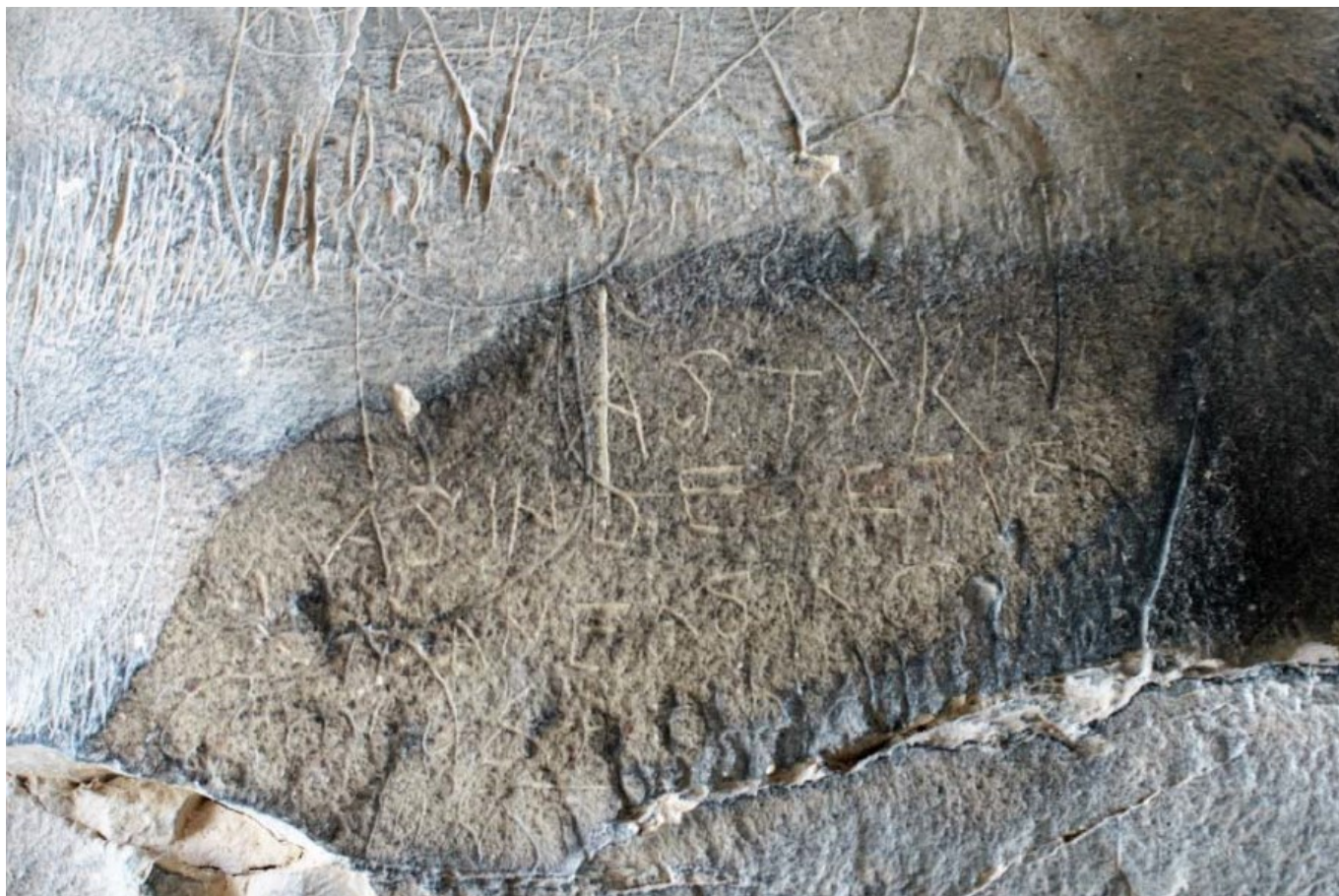
Captura de pantalla 2024-12-101224