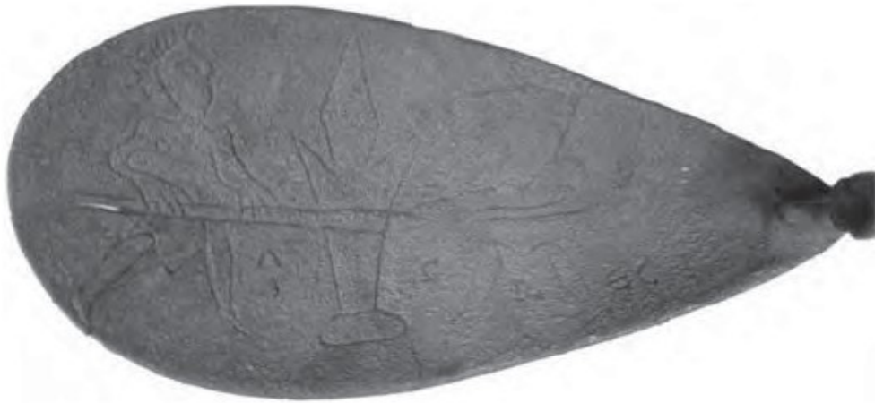
Figura 6: Detalle de la cazoleta de la cochear documentada en el enterramiento 212 con la escena mitológica y el nombre de AGRECI .