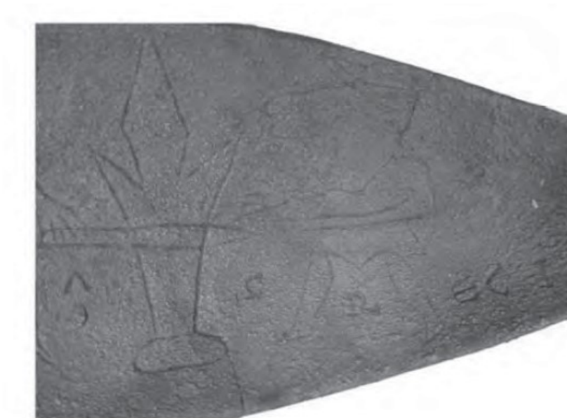
Figura 7: En la imagen superior se puede ver en detalle la imagen de Teseo y en la inferior el minotauro. En ambas se ve el elemento que las separa, que bien pudiera ser una hoguera, y las letras que conforman el nombre de AGRECI .