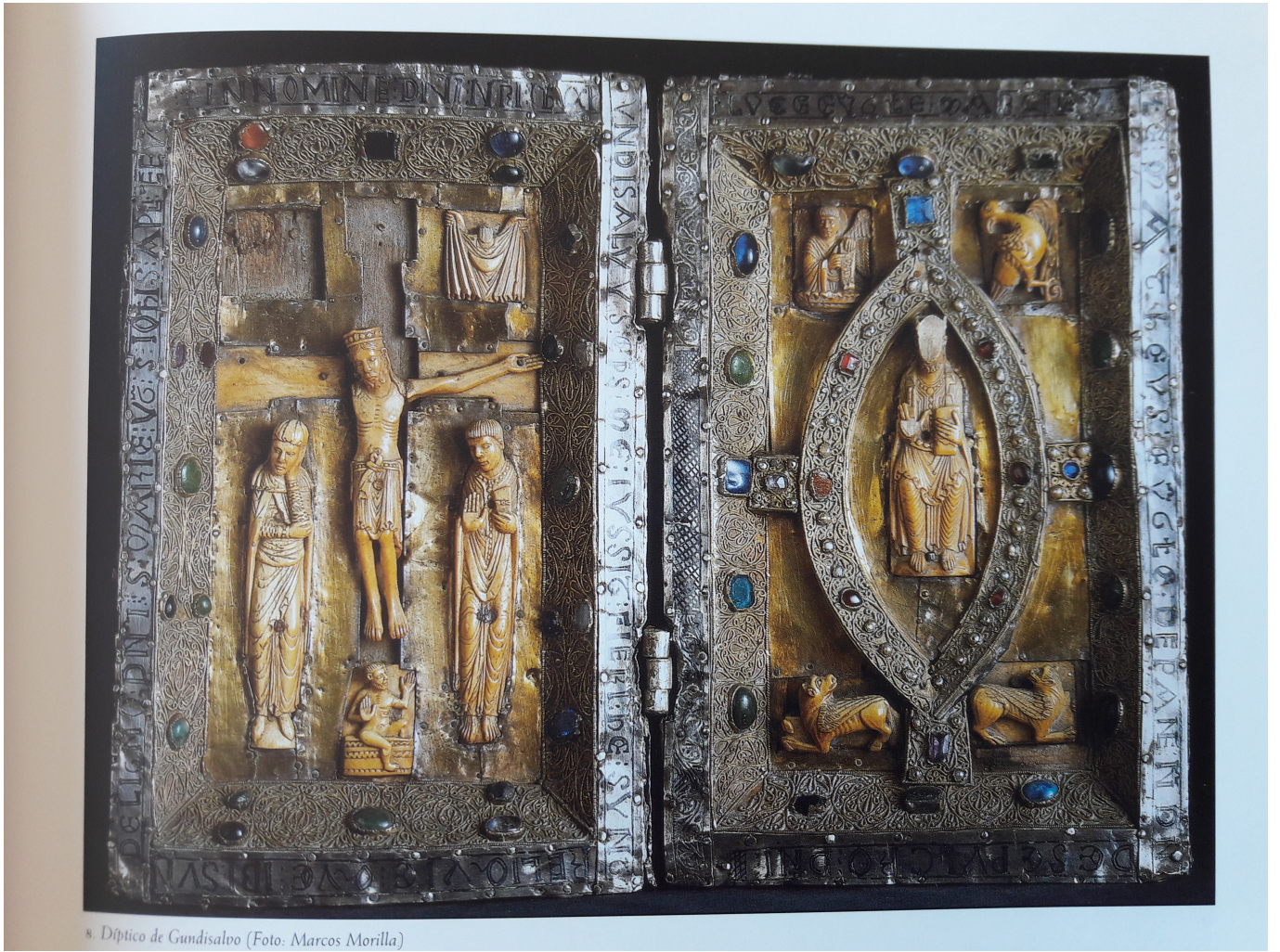
8. Diptico de Gundisalvo