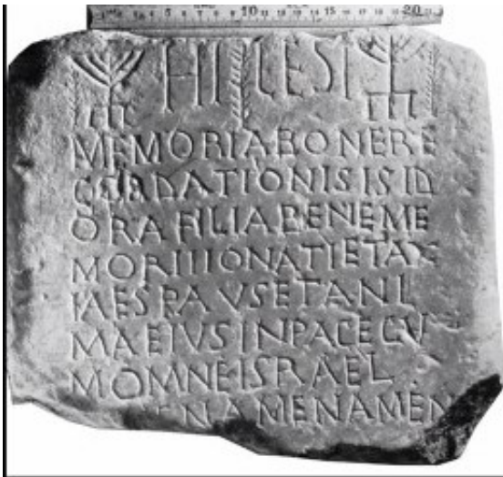
Captura de pantalla 2022-10-182729