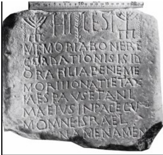
Captura de pantalla 2022-10-182729