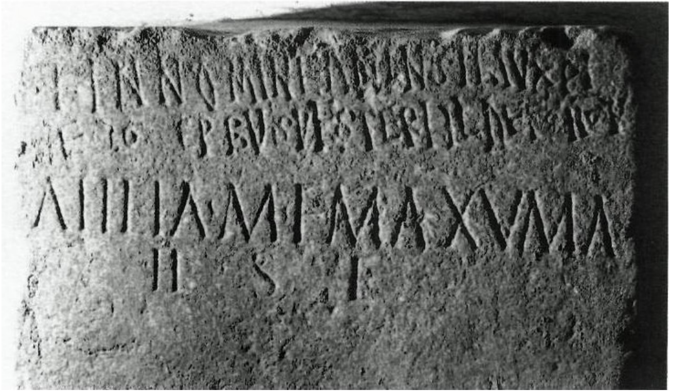
csdcd - copia