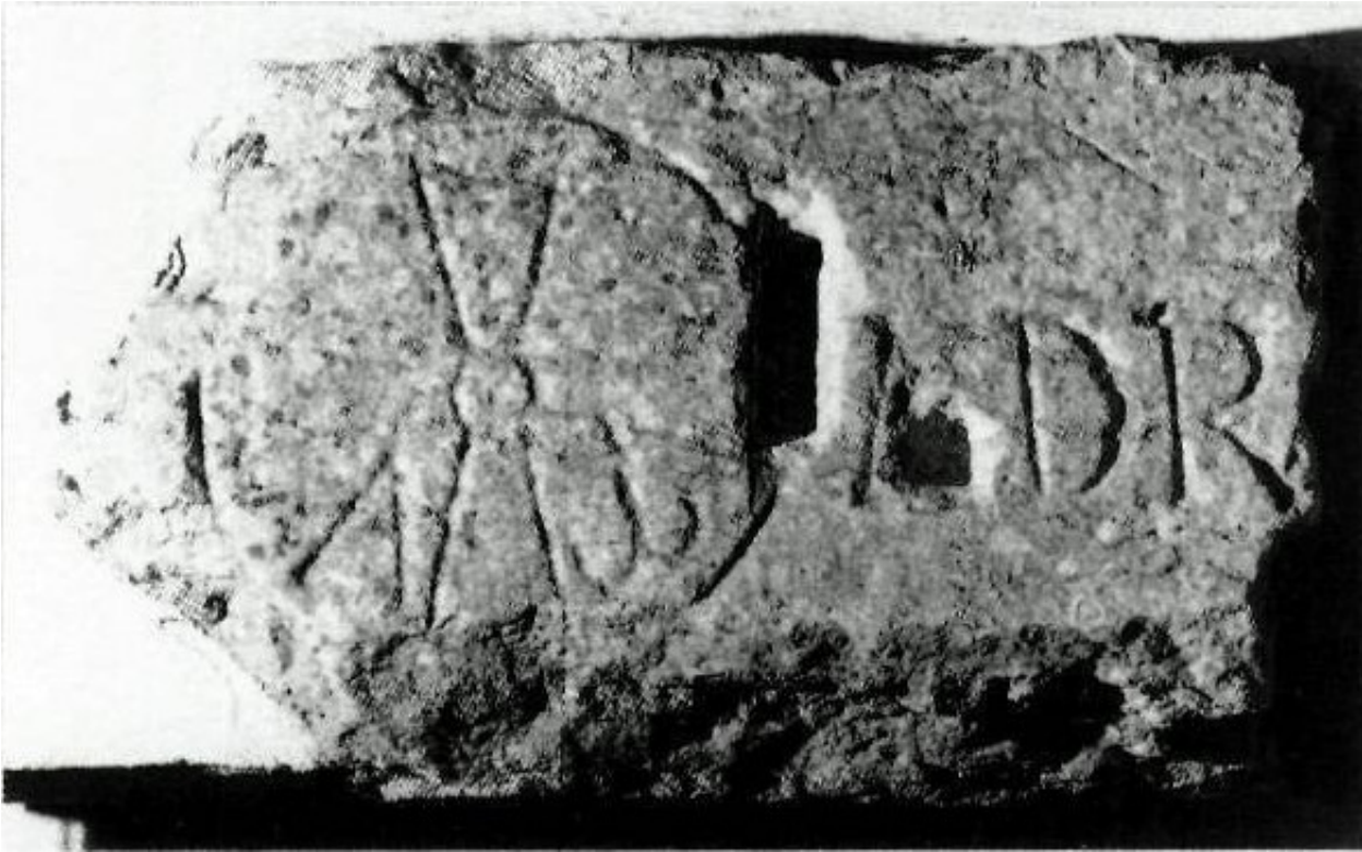
sdcsdcds - copia - copia