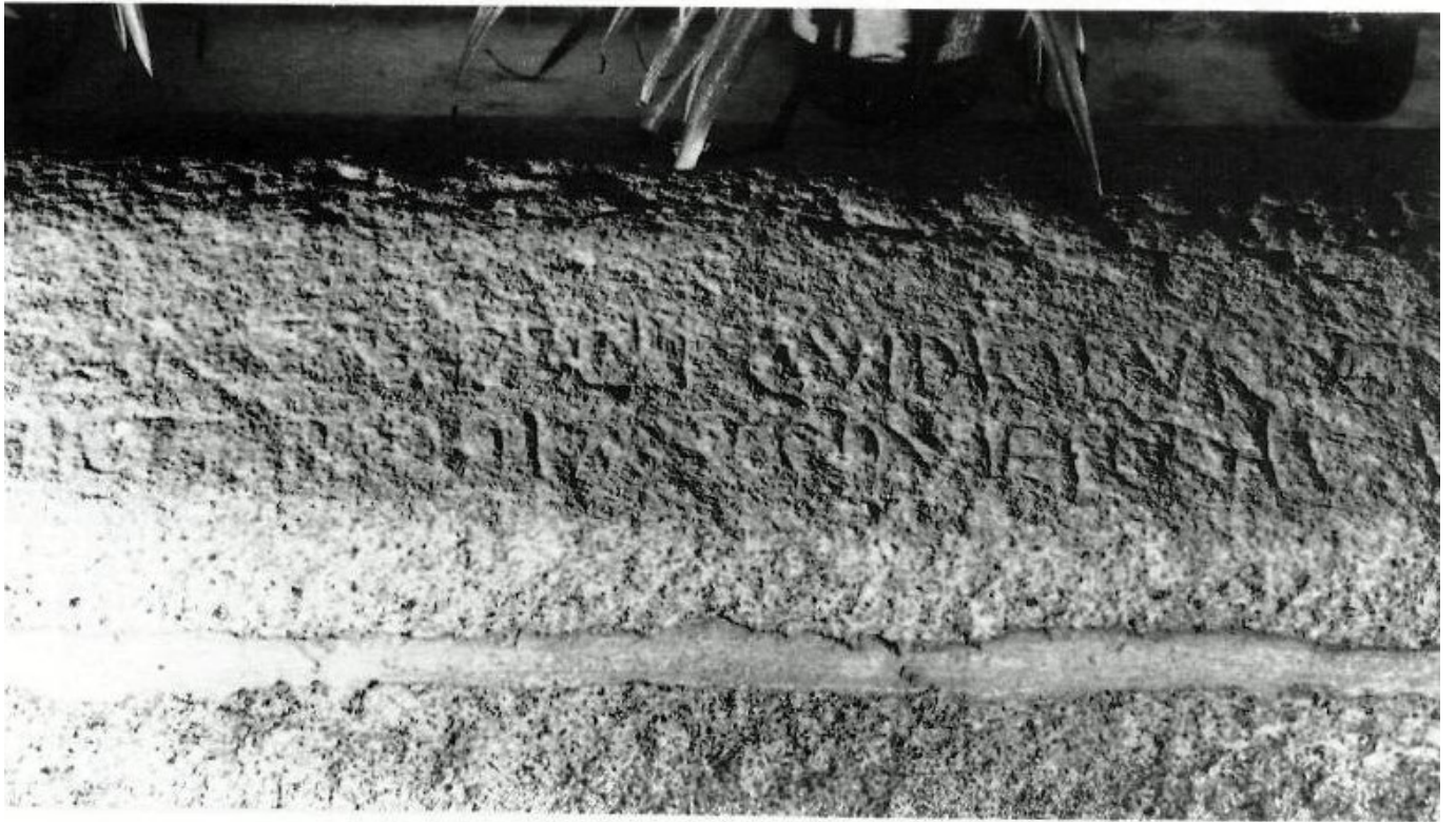
Est. IX - copia