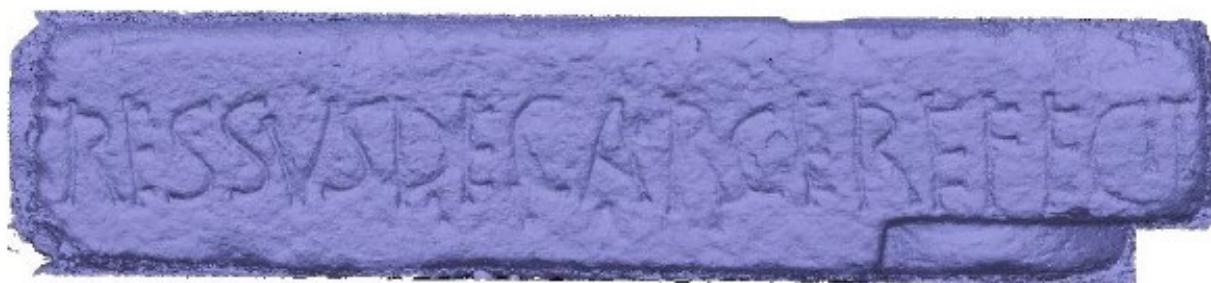
Imagen POR45. Modelos generados con Agisoft Metashape.