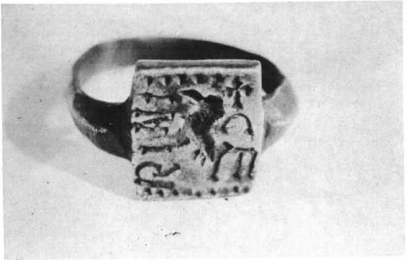
Anillo con inscripción procedente de «El Santiscal»