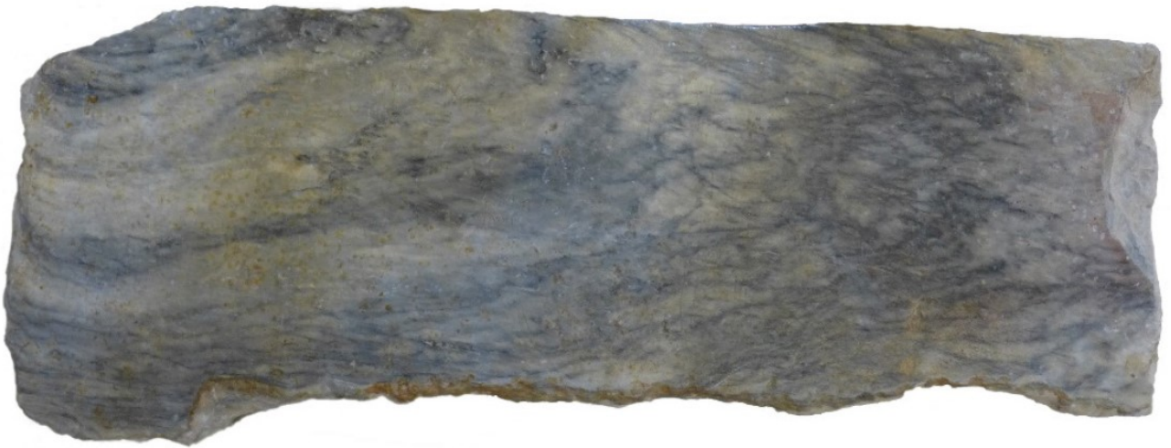
Fig. 7. Parte anterior del tablero de altar.