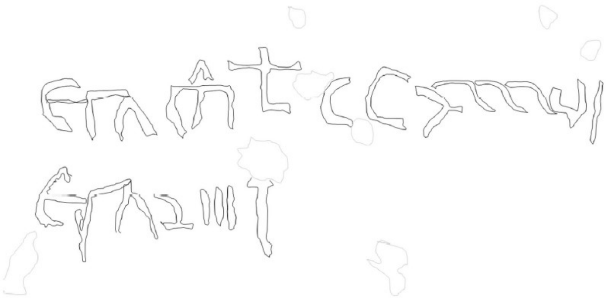
Fig. 19. Datatio, sobredibujada.