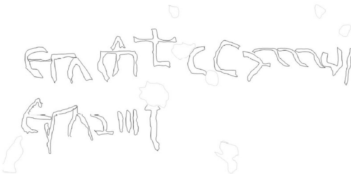
Fig. 19. Datatio, sobredibujada.