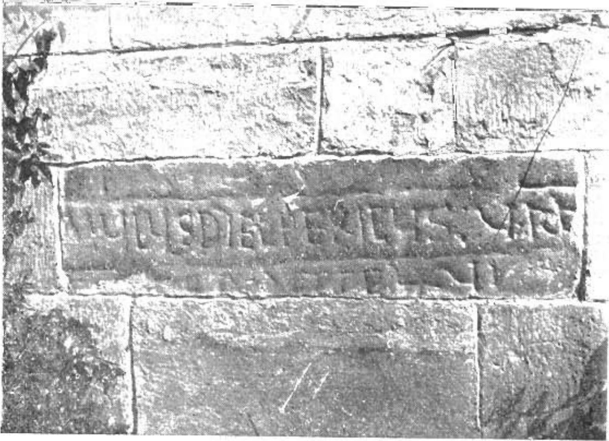
Manzanares Rodríguez 1951, fig. 8