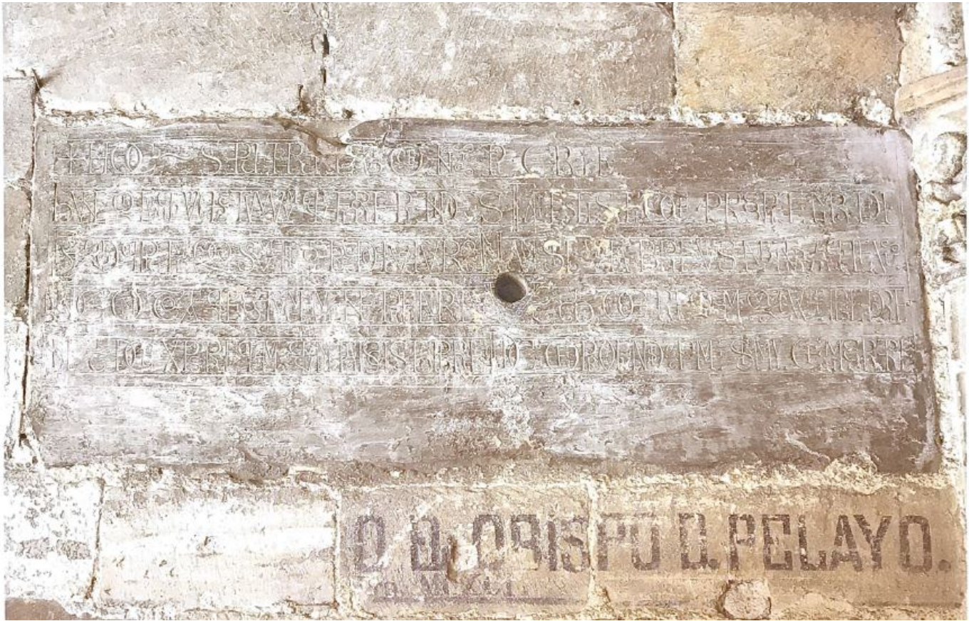
Obispo Pelayo, p. 71