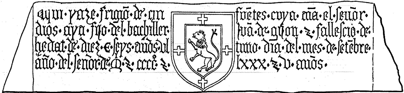
47. Frigión de Cifuentes. Debajo: dibujo de Vigil.