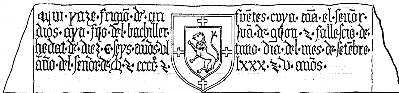
47. Frigión de Cifuentes. Debajo: dibujo de Vigil.