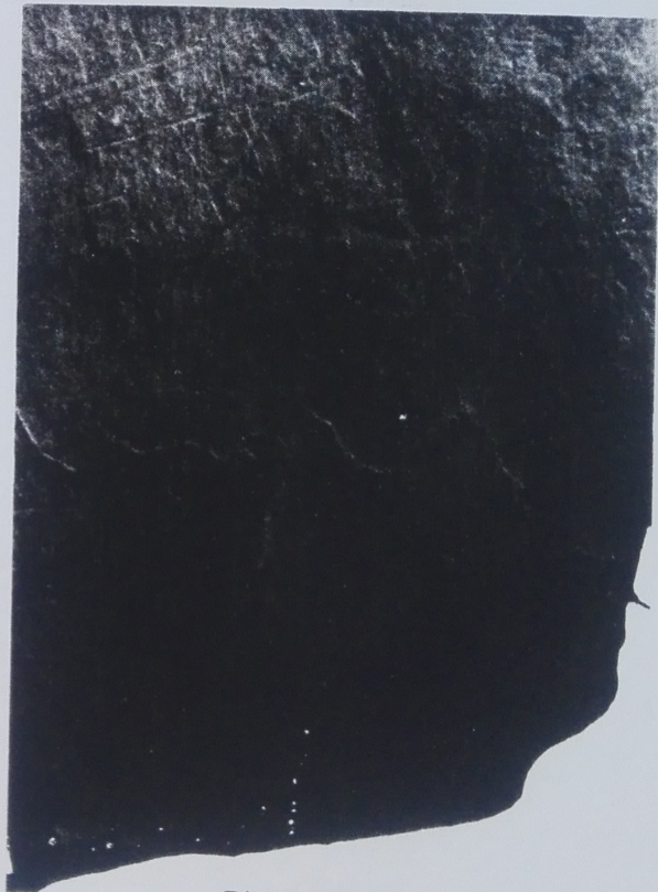
Pizarra 45, fragmento mayor. Detalles de la pieza limpia.