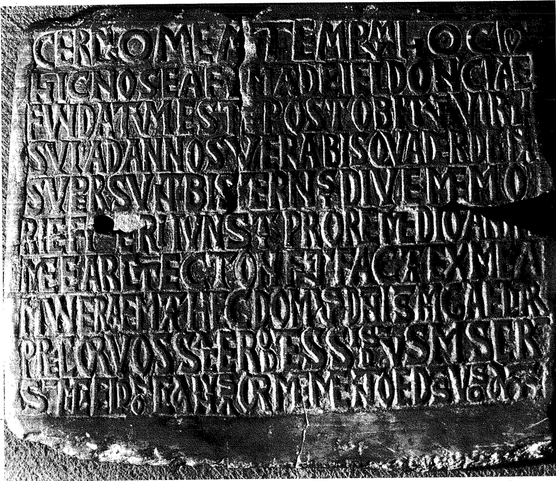
182. Lápida de la iglesia de San Miguel.