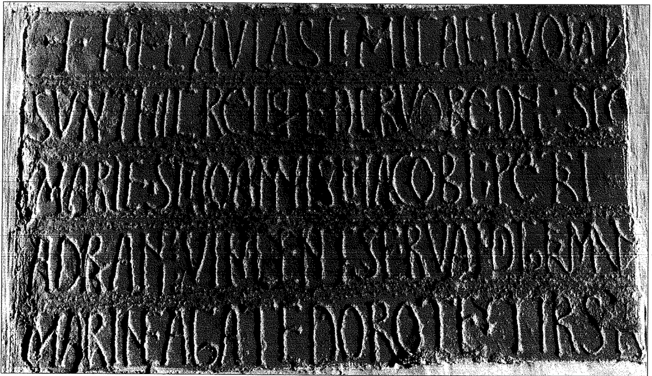
205 a. Reliquias de la iglesia de San Miguel de Quiloño.