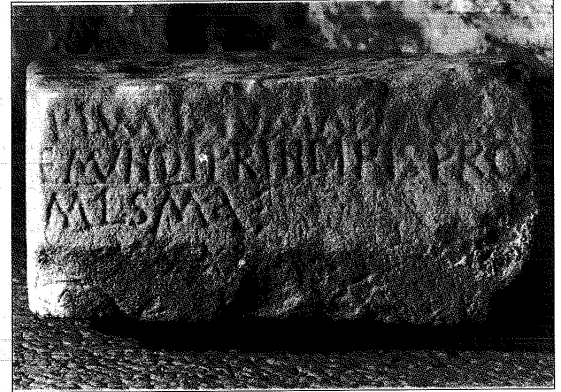
216. Consagración de la iglesia de Baones (hoy parroquial de Granda).