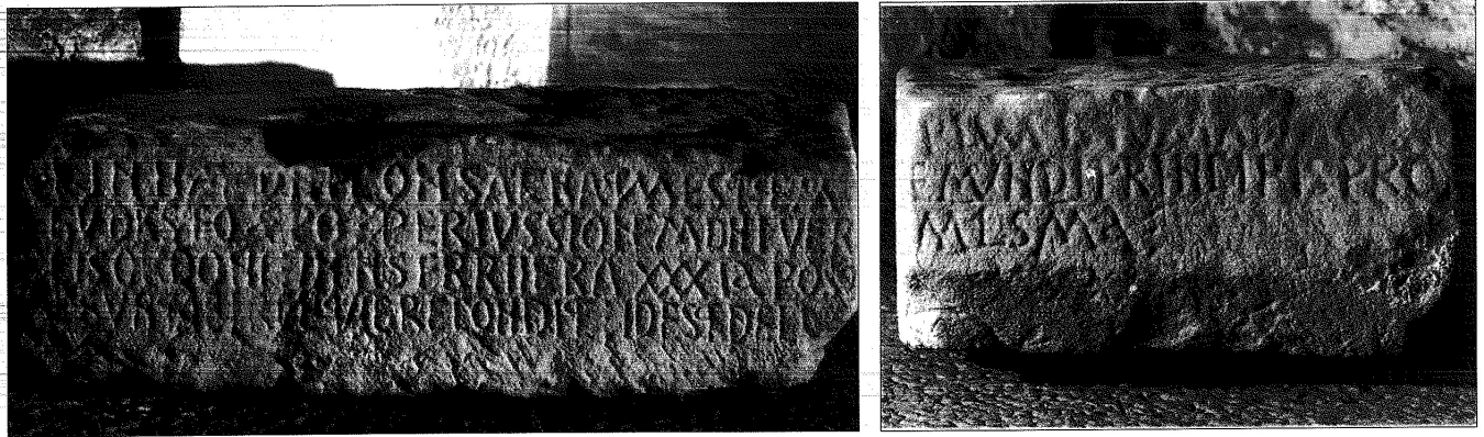
216. Consagración de la iglesia de Baones (hoy parroquial de Granda).