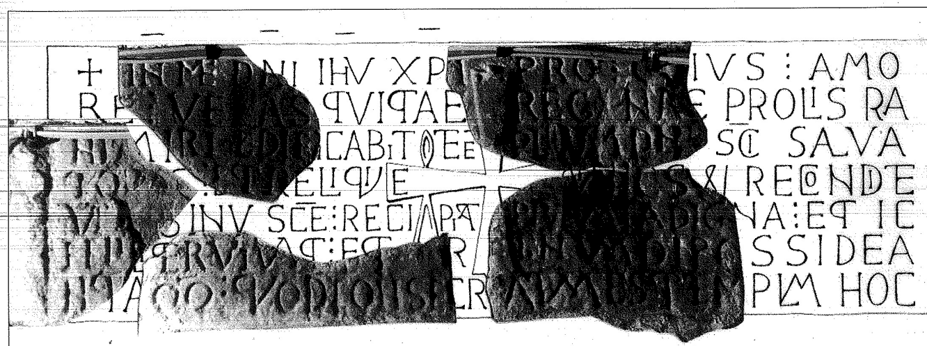
217. Inscripción fundacional de la iglesia de Deva. Composición de A. Diego Llaca.