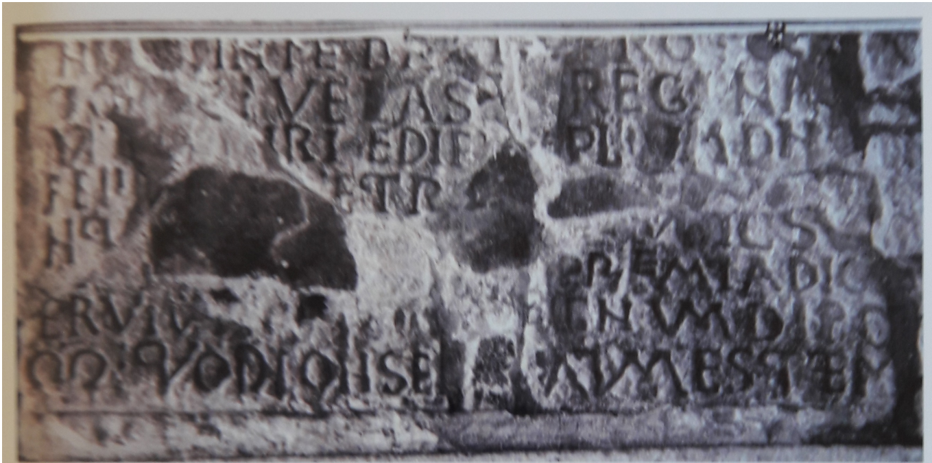
Estado actual de la lápida