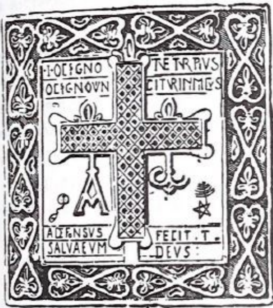
Fig. 47. San Martín de Salas: Piedra en la fachada meridional.