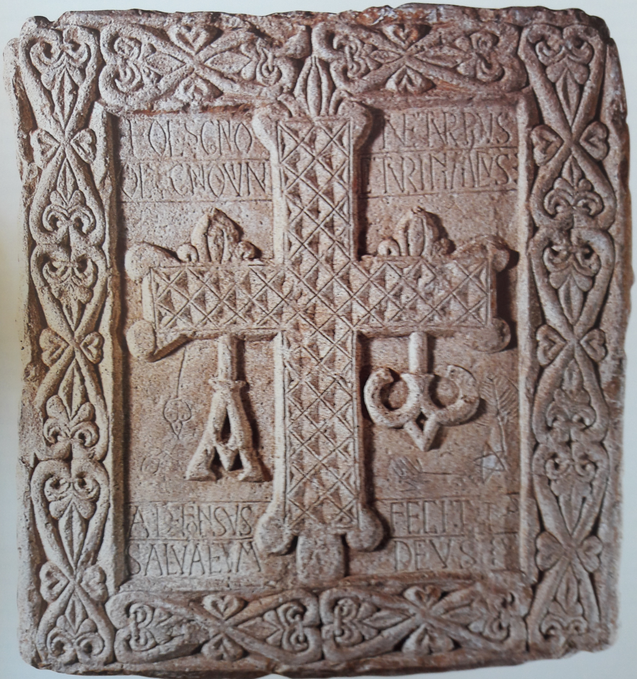
Lápida con cruz latina (nº 4)