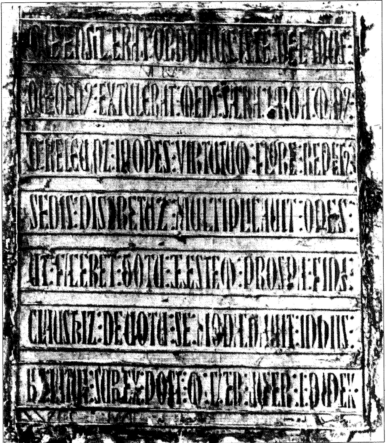
234 a. Deán Ordoño (en la Sala Capitular).