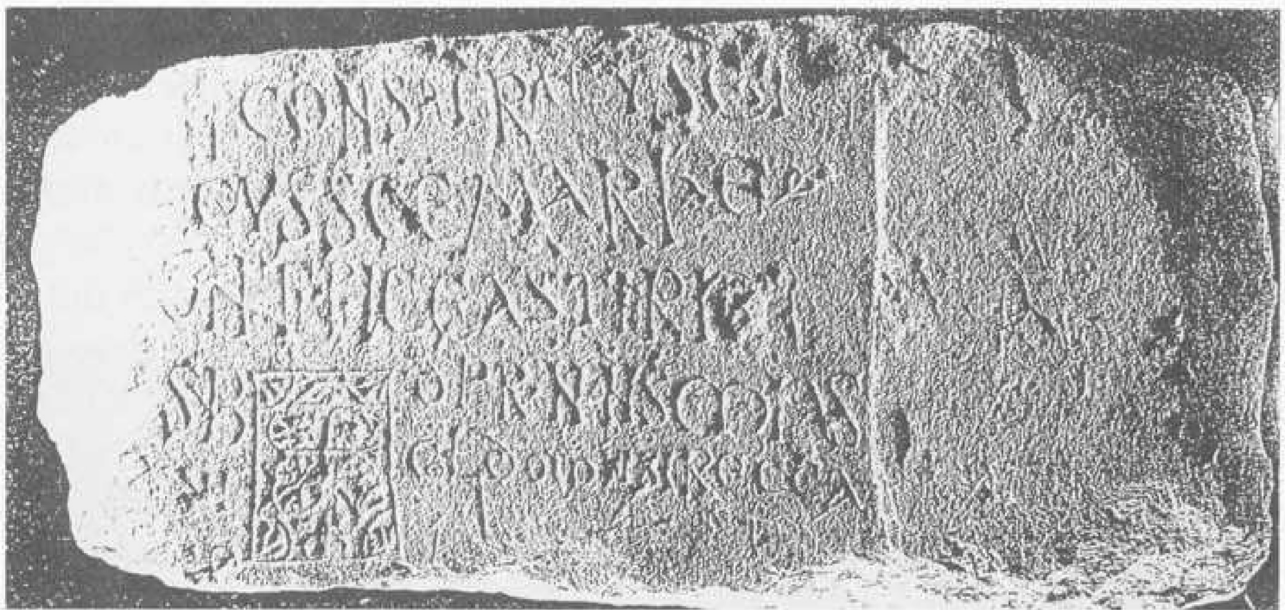
Mijangos: Inscripción visigótica.