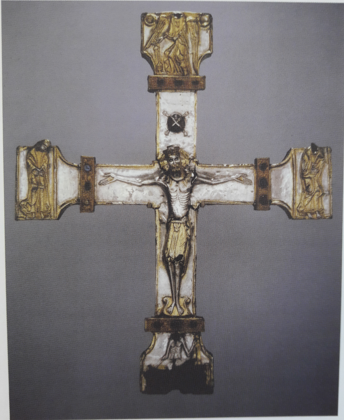
Cruz procesional (The Metropolitan Museum of Art, Nueva York)

Guidisalvo me hizo). El centro de la pieza lo ocupa la