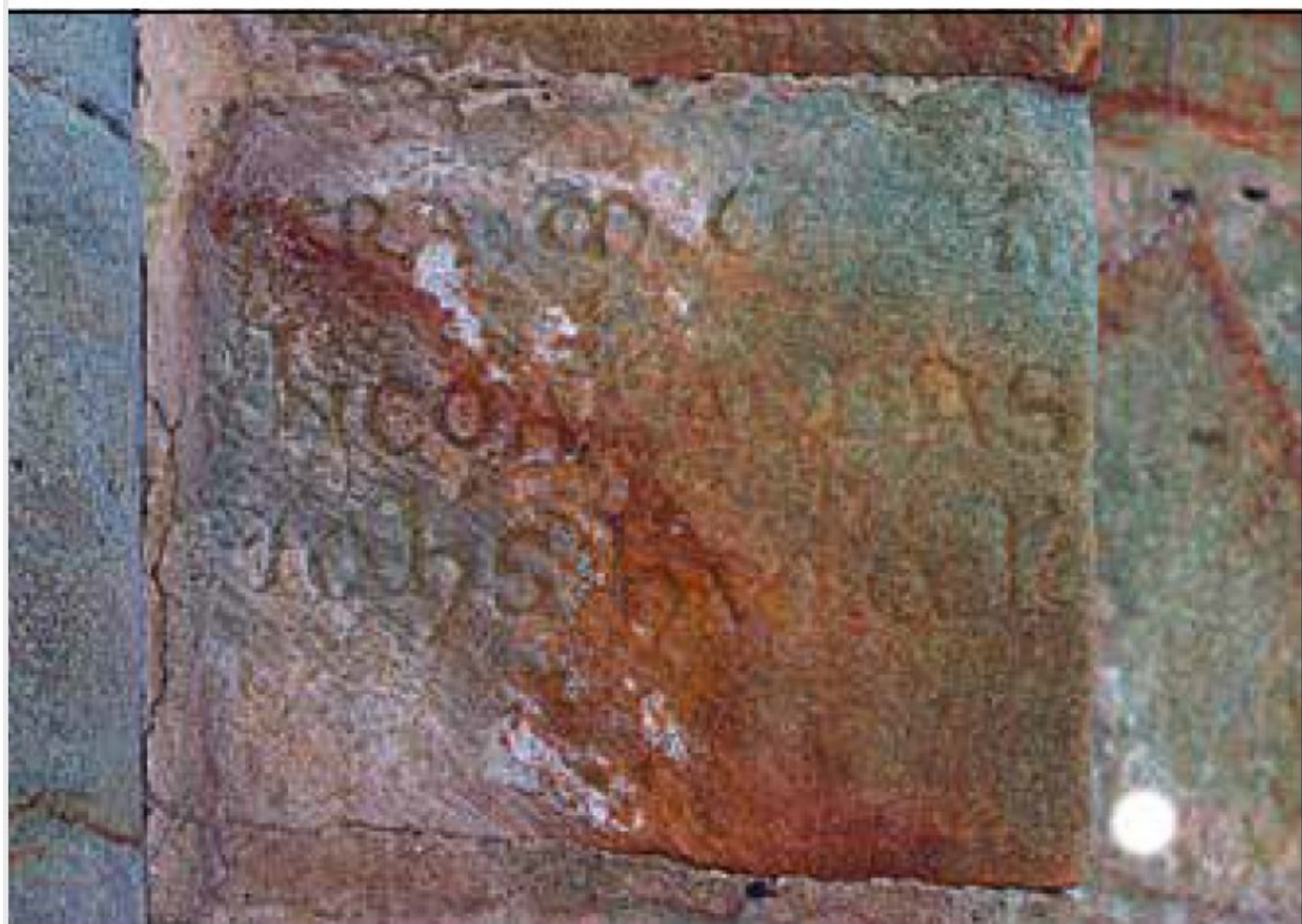
Figura 1. Επίγραφε fundacional del abad Juan.