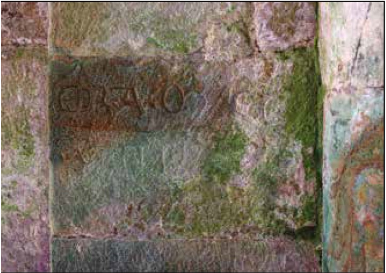
Figura 2. Epígrafe con fecha.