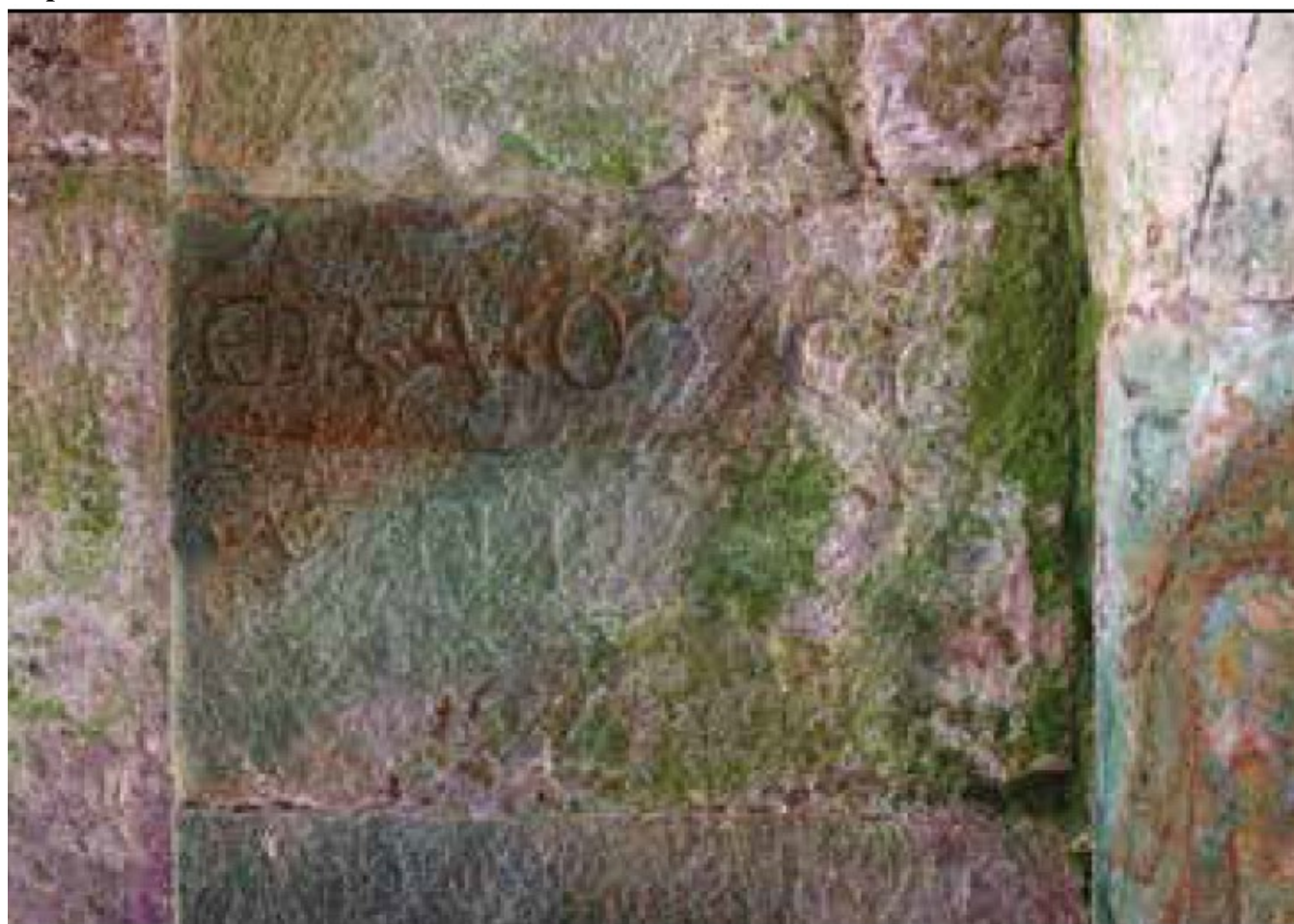
Figura 2. Epígrafe con fecha.