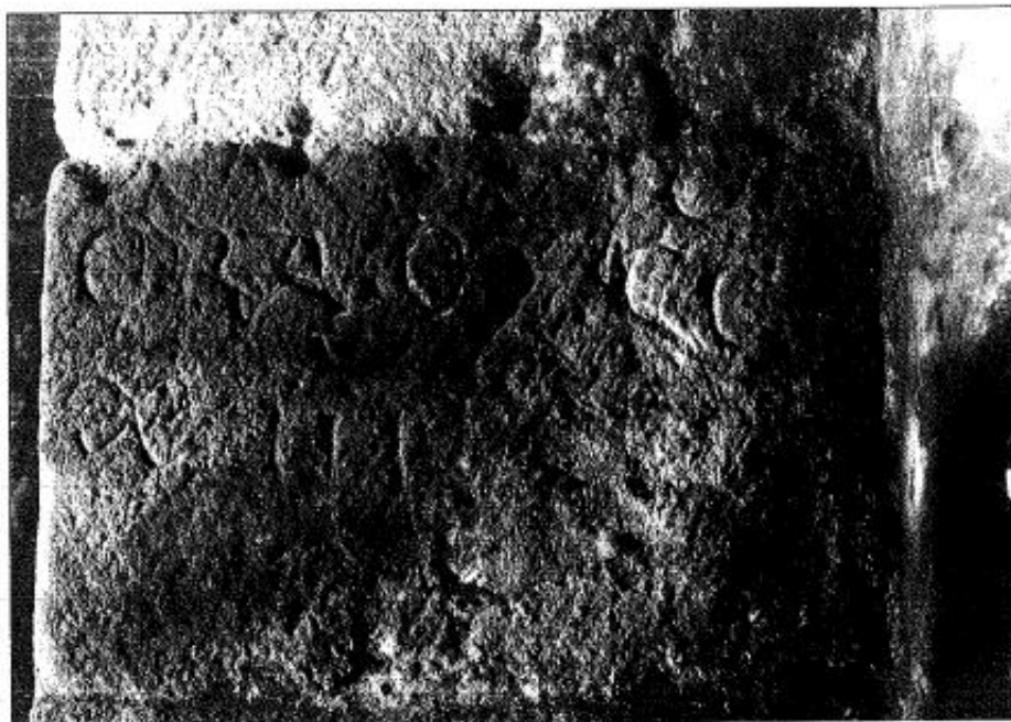
256 b. Abad Juan I.