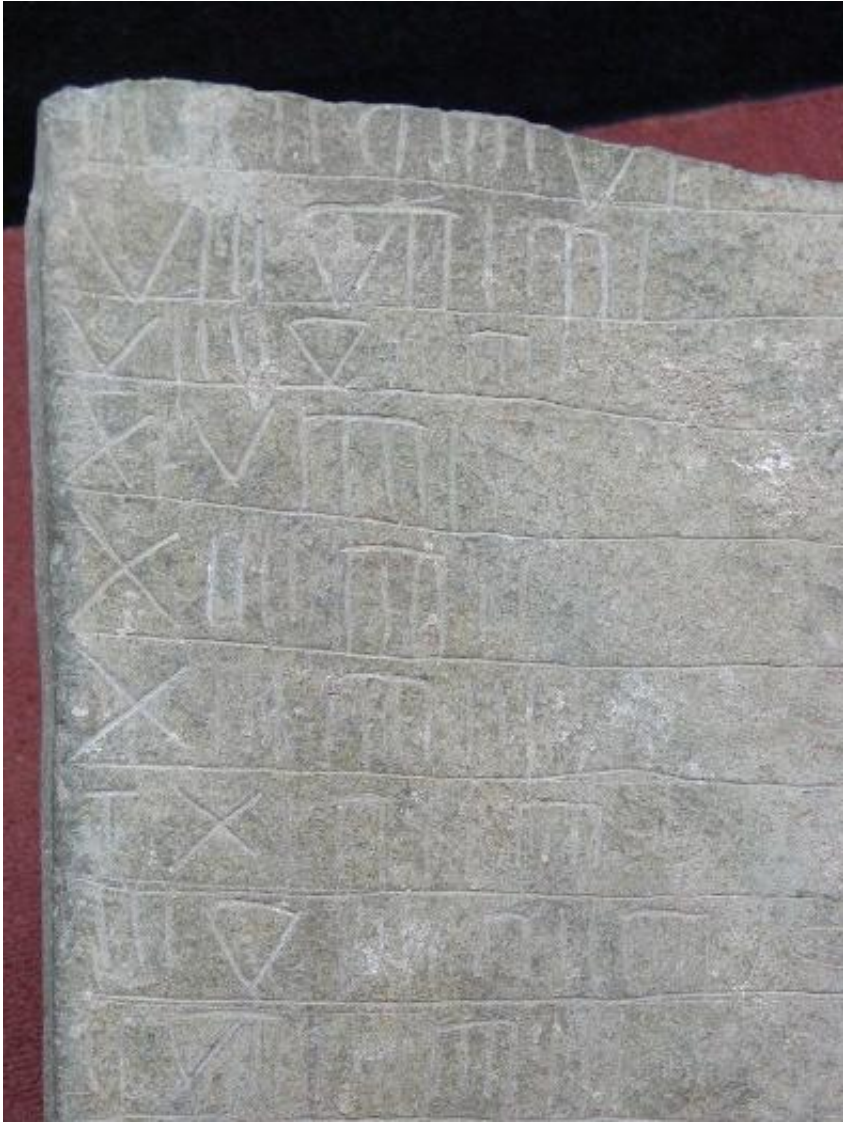
MUSVALLEMAVA SEQ P