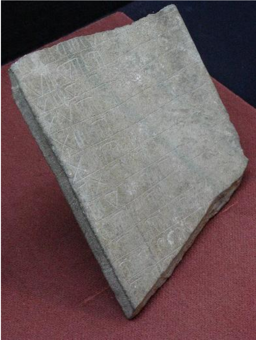
MUSVALLEMAVA SEQ P