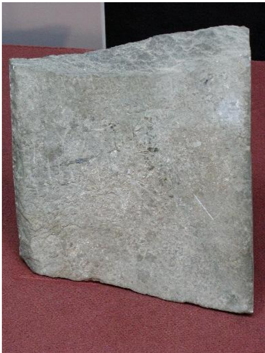
MUSVALLEMAVA SEQ P