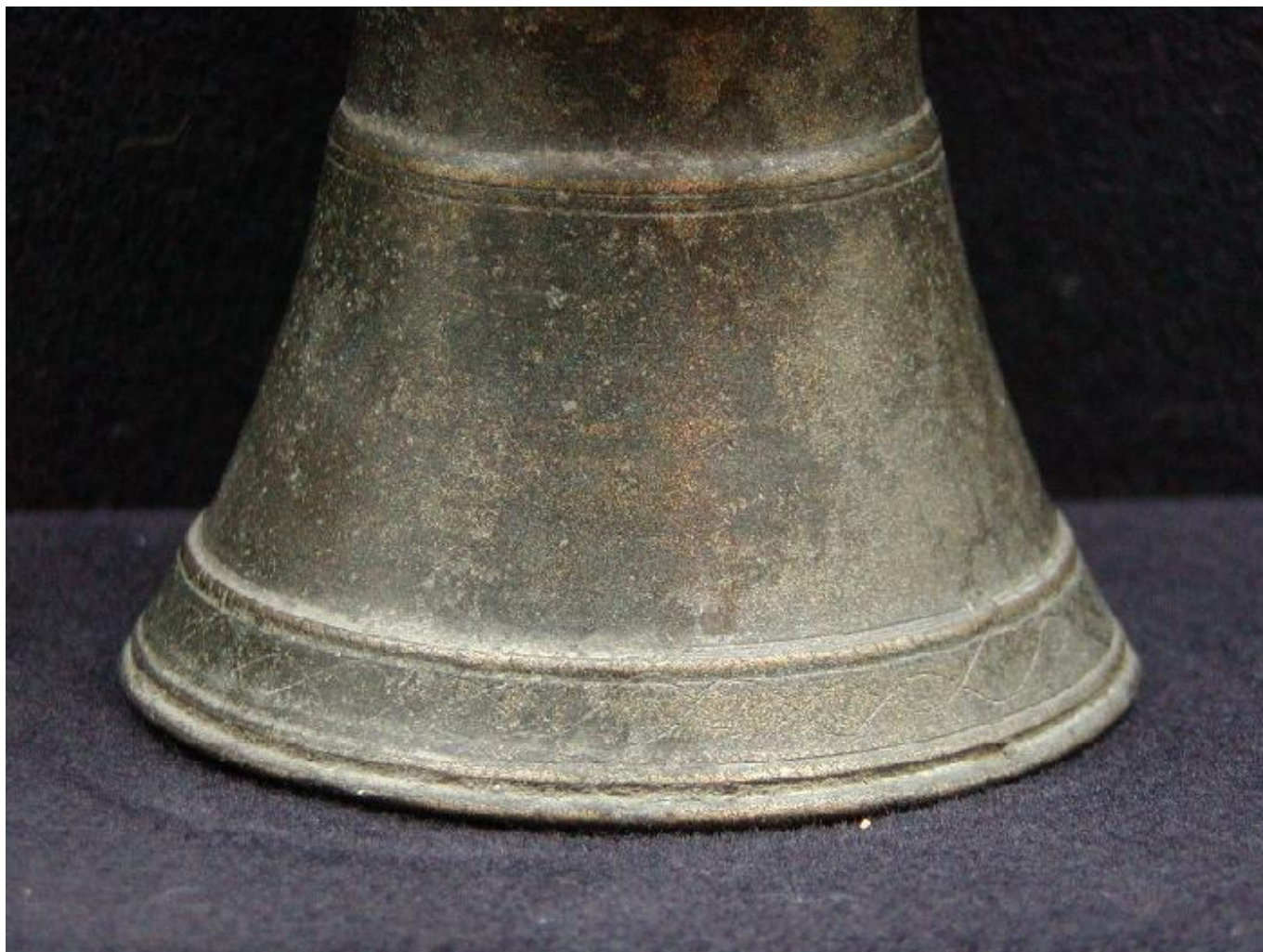
MUSVALLFMAVA SEQ P