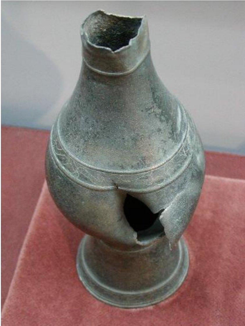
MUSVALLEMAVA SEQ P