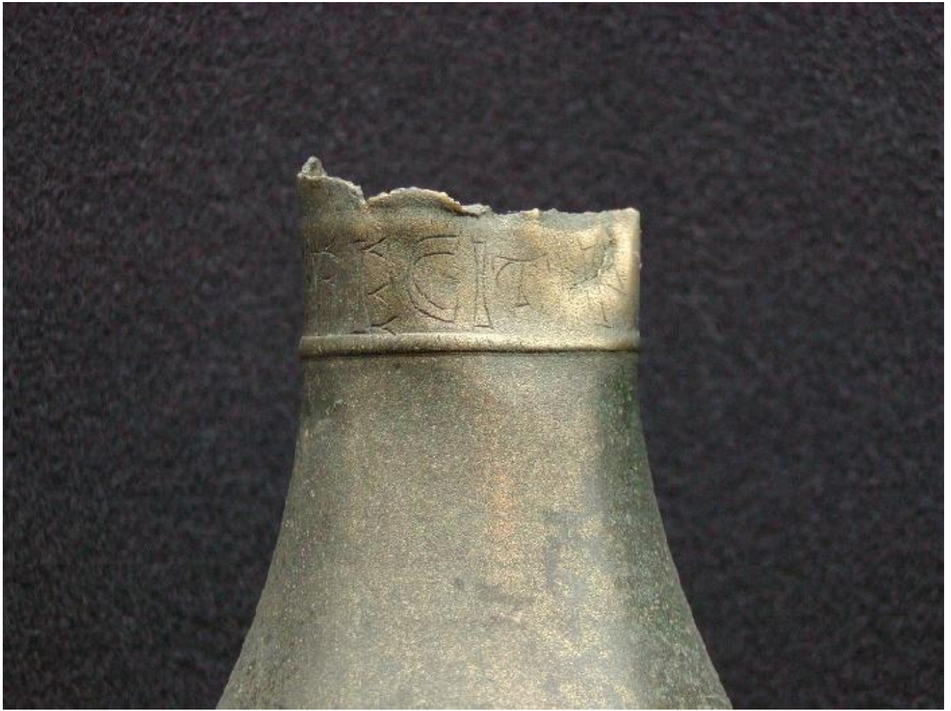
MUSVALLFMAVA SEQ P