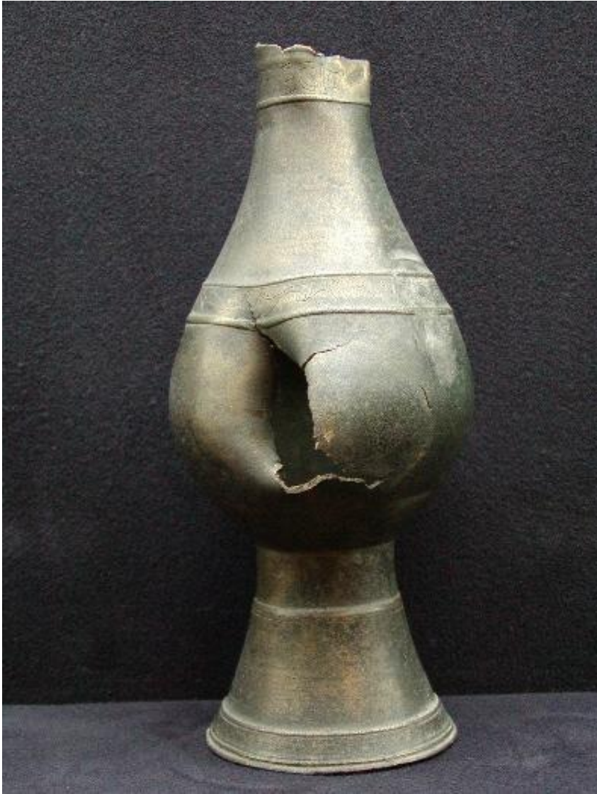
MUSVALLEMAVA SEQ P