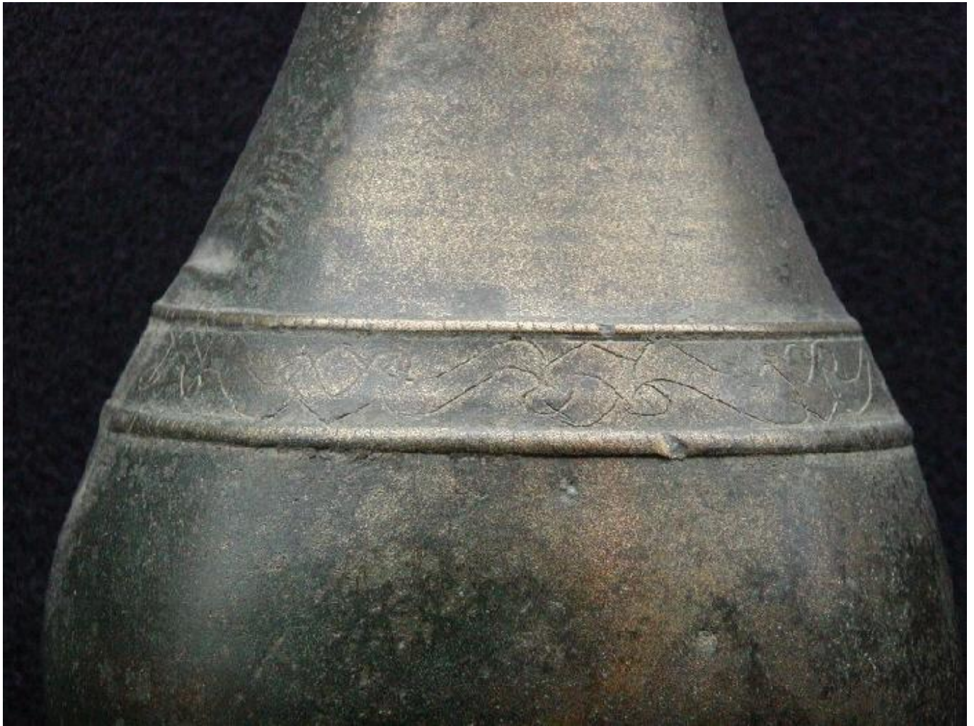
MUSVALLFMAVA SEQ P