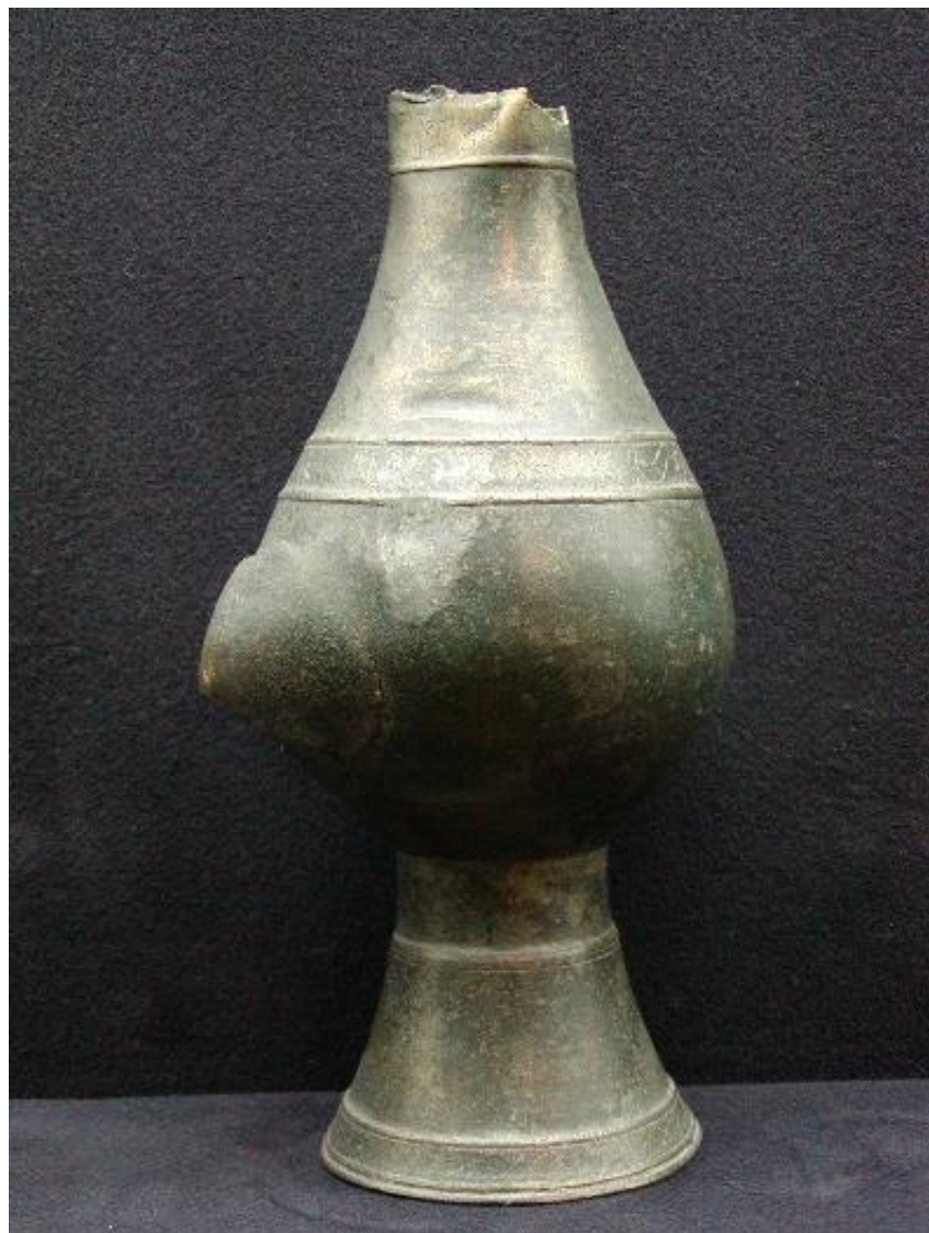
MUSVALLEMAVA SEQ P