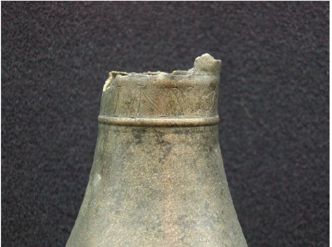
MUSVALLEMAVA SEQ P