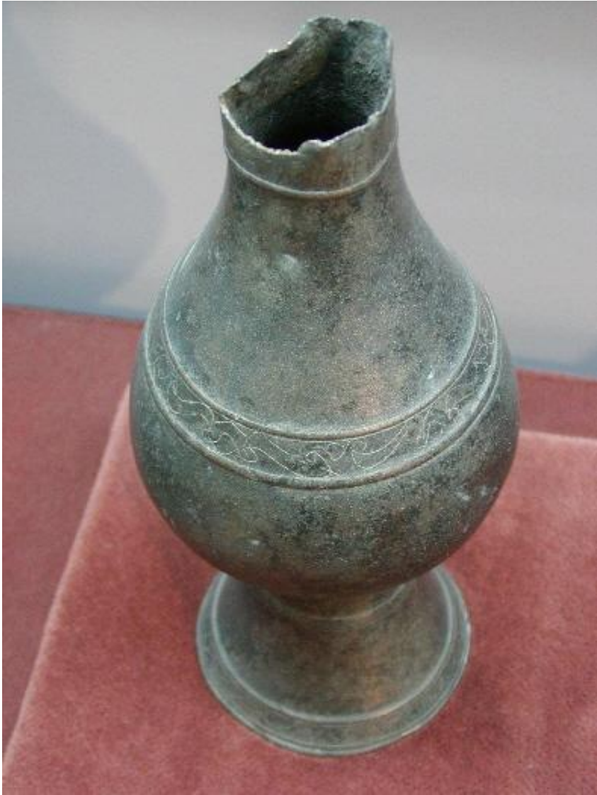
MUSVALLEMAVA SEQ P