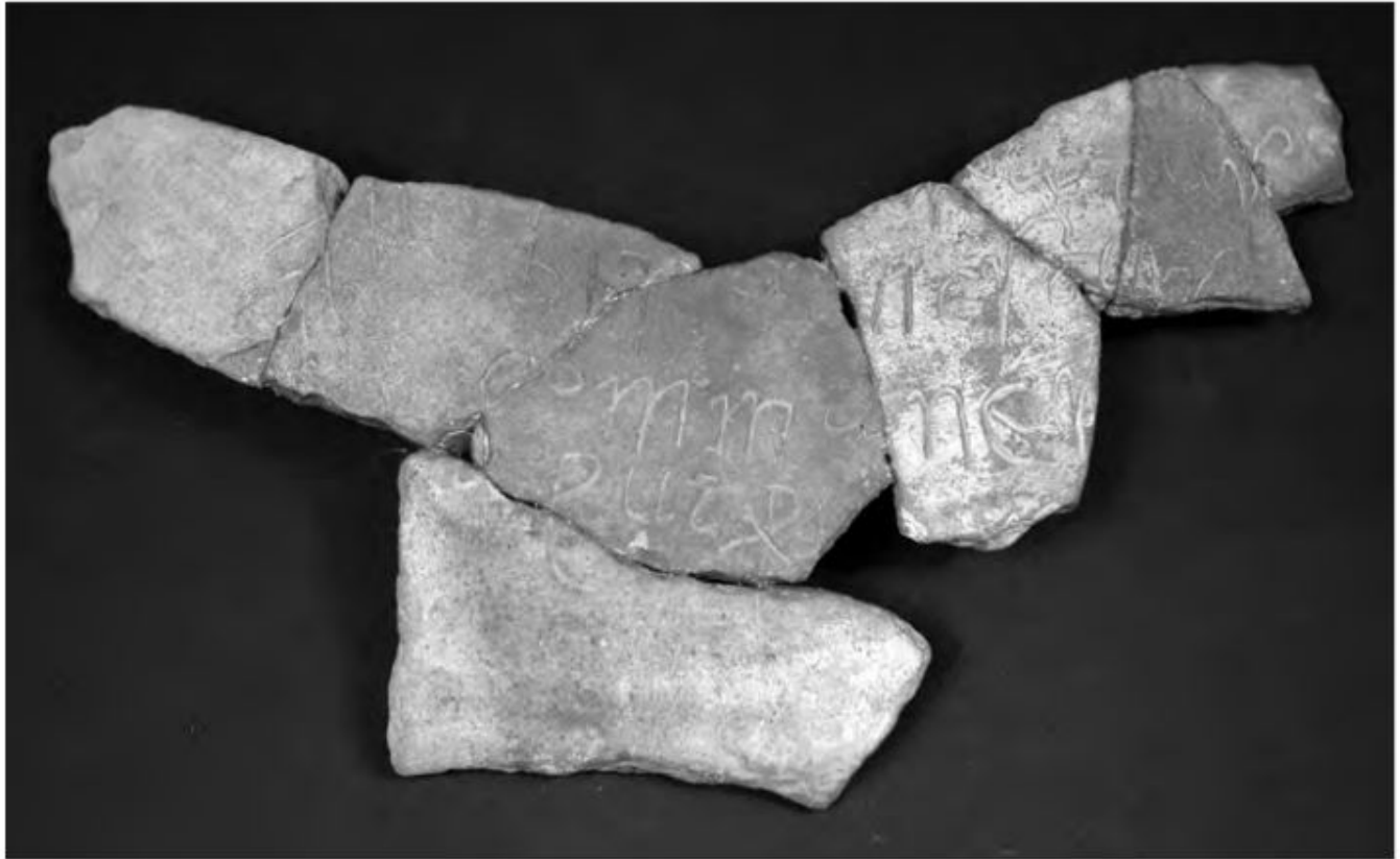
Fig. 3. Grafito de Fontcalent (Alicante).