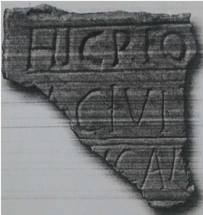
Figura 1: Fotografia del nou fragment (Foto: J. López).