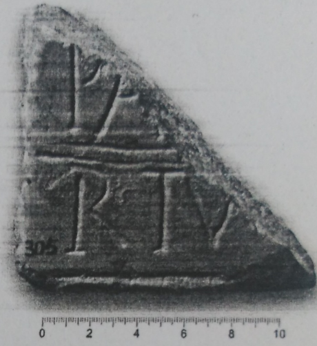
Figura 2: RIT 1036.