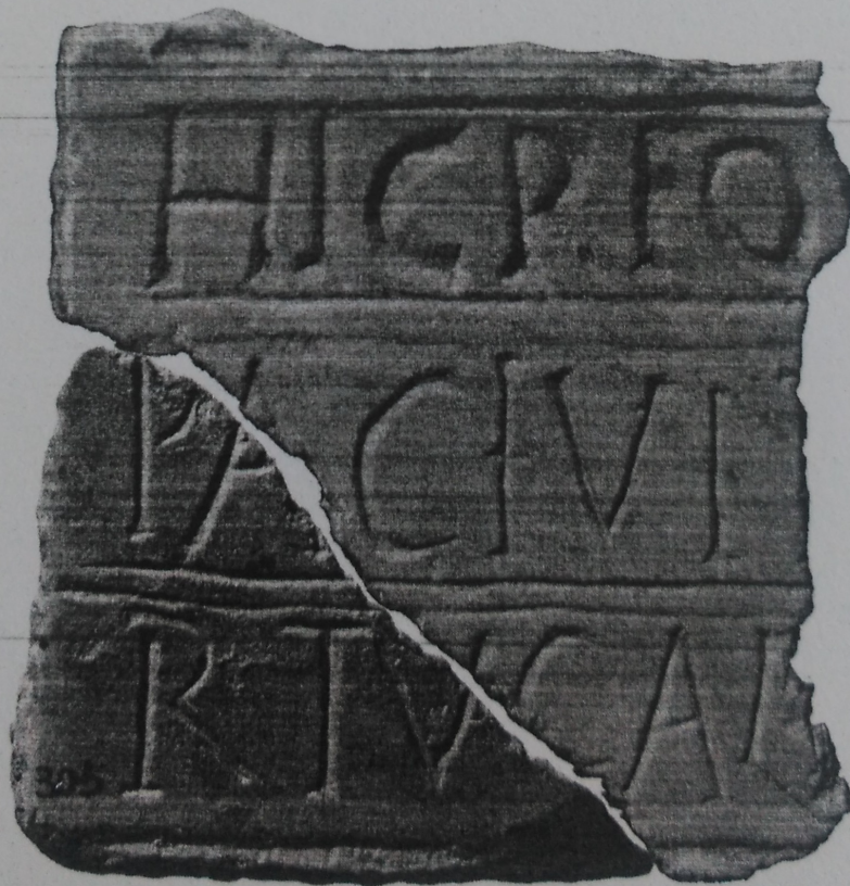
Figura 3: Fotomuntatge de RIT 1036 i el nou fragment recuperat (J.M. Puche).